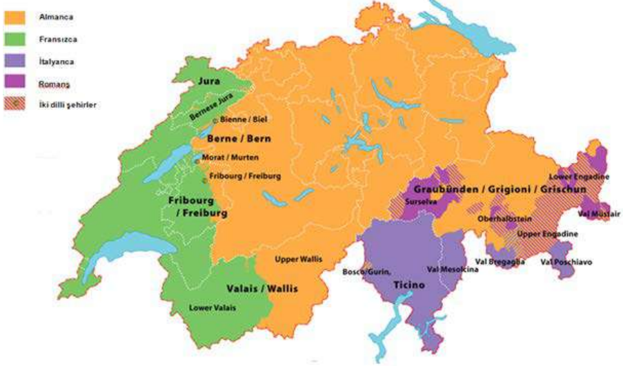
Şekil 1. İsviçre’de Konuşulan Dillerin Coğrafi Dağılımı (Akt. Stadtschnitzer ve Schmidt, 2018)

Şekil 1 incelendiğinde İsviçre’de konuşulan dört farklı dil olduğu görülmektedir. Ülkenin kuzeyinde ve orta bölümünde Almanca, batısında Fransızca, güneyinde İtalyanca ve güneydoğusunda Romanş dilinin konuşulduğu ve iki dilli şehirlerin olduğu görülmektedir. Avrupa’nın tam ortasında yer alması, yakınında bulunan diğer komşu ülkelerle olan bağları, konuşulan dillerin ve etnik yapıların çeşitliliği gibi etmenlerin İsviçre’nin kültürünün oluşmasında etkili olduğu söylenebilir. İsviçre’deki bu farklı kültür karakteristiği edebiyat, sanat, mimari ve müzik gibi alanlarda da görülebilmektedir (Arı, 2006).