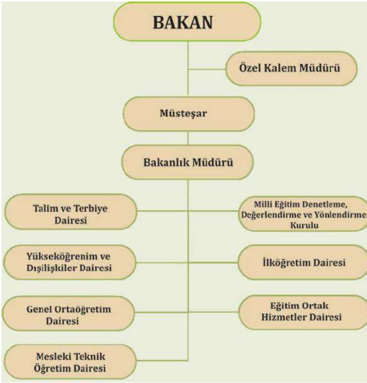
Şekil 2. KKTC Millî Eğitim Bakanlığı Örgüt Şeması (KKTCMEB, 2023)

Şekil 2 incelendiğinde KKTC Millî Eğitim Bakanlığı teşkilatının bakan, özel kalem müdürü, müsteşar ve bakanlık müdüründen oluştuğu görülmektedir. Ayrıca Bakanlık bünyesinde; Talim ve Terbiye Dairesi, Milli Eğitim Denetleme, Değerlendirme ve Yönlendirme Kurulu, Yükseköğrenim ve Dışişlikler Dairesi, İlköğretim Dairesi, Genel Ortaöğretim Dairesi, Mesleki ve Teknik Ortaöğretim Dairesi Müdürlüğü, Eğitim Ortak Hizmetler Dairesi yer almaktadır.