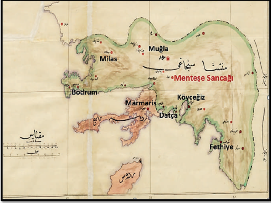
Harita 3: Menteşe Sancağı Haritası 10

Menteşe Sancağı'nın kuzeyinde Aydın ve Denizli sancakları, doğusunda Konya Vilayeti, güneyinde ve batısında Adalar Denizi yer almaktadır. Muğla Sancağı; Muğla , Milas , Bodrum , Marmaris , Köyceğiz ve Megri (Fethiye) kazalarından ibaret olup, aynı zamanda Bozüyük , Ula , Dadya (Datça) ve Eşen isimli dört nahiyeye ve 377 köy ile 46 mahalleye sahiptir. 9