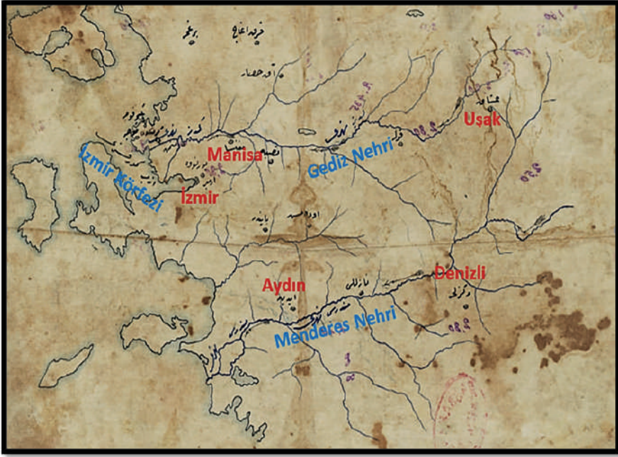
Harita 2: Batı Anadolu Haritası 7

Mekteb-i İdadi Tarih ve Mekteb-i Mülkiye-i Şahane Coğrafya Muallimi Kaymakam Ali Tevfik tarafından yazılan “ Memâlik-i Osmaniye Coğrafyası ” adlı eserde, Aydın Vilayeti’nin sınırları; “ Anadolu-yı şabanenin vilayât-ı meşhuresinden olub şimalen ve şarken Hüdavendigâr vilayeti ile mahdud olarak cenûb-ı şarkiyesinde Konya vilayeti vaki’ ve garbi adalar denizine sahibdir. ” şeklinde verilmiştir. Aydın Vilayeti’nin idarî olarak İzmir, Aydın, Saruhan, Menteşe ve Denizli olmak üzere beş adet mutasarrıflığa taksim olunduğu belirtilmiştir. Vilayet merkezi İzmir şehridir. İlgili mutasarrıflıkların merkez idareleri kendi isimlerindeki kasabalar ise de yalnız Saruhan Mutasarrıfı Manisa’da ve Menteşe mutasarrıfı Muğla kasabasında oturmuştur. 6