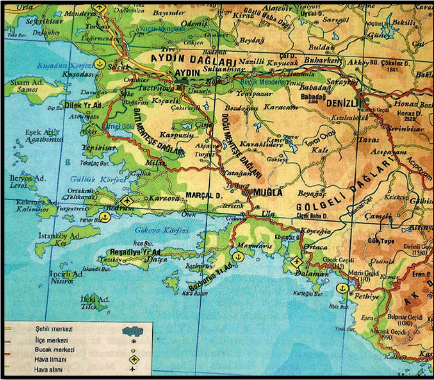
Harita 1: Mentеше Bölgesi 5

Bodrum, Batı Anadolu'nun güneyinde yer alıp, bugün Muğla İli'ne bağlı bir ilçedir. 19. yüzyılda ise Aydın Vilayeti Mentеше Sancağı'na bağlı bir kazadır. 2 İçinde bulunduğu Mentеше bölgesi, Büyük Menderes Vadisi'nin orta ve aşağı kesimleri güneyinde yer alan bölgeyi kapsamaktadır. İç Mentеше ve Dış Mentеше olmak üzere ikiye ayrılır. Büyük Menderes'in denize döküldüğü yerden Köyceğiz'e bir hat çizilirse bunun doğusunda kalan kısım İç Mentеше , batısında kalan kısım ise Dış Mentеше olarak kabul edilir. 3 Bodrum, Mentеше yöresinin batısında Güllük Körfezi ile Gökova Körfezi arasında geniş başlı ve dar boyunlu bir yarımda şeklinde yer almaktadır. 4