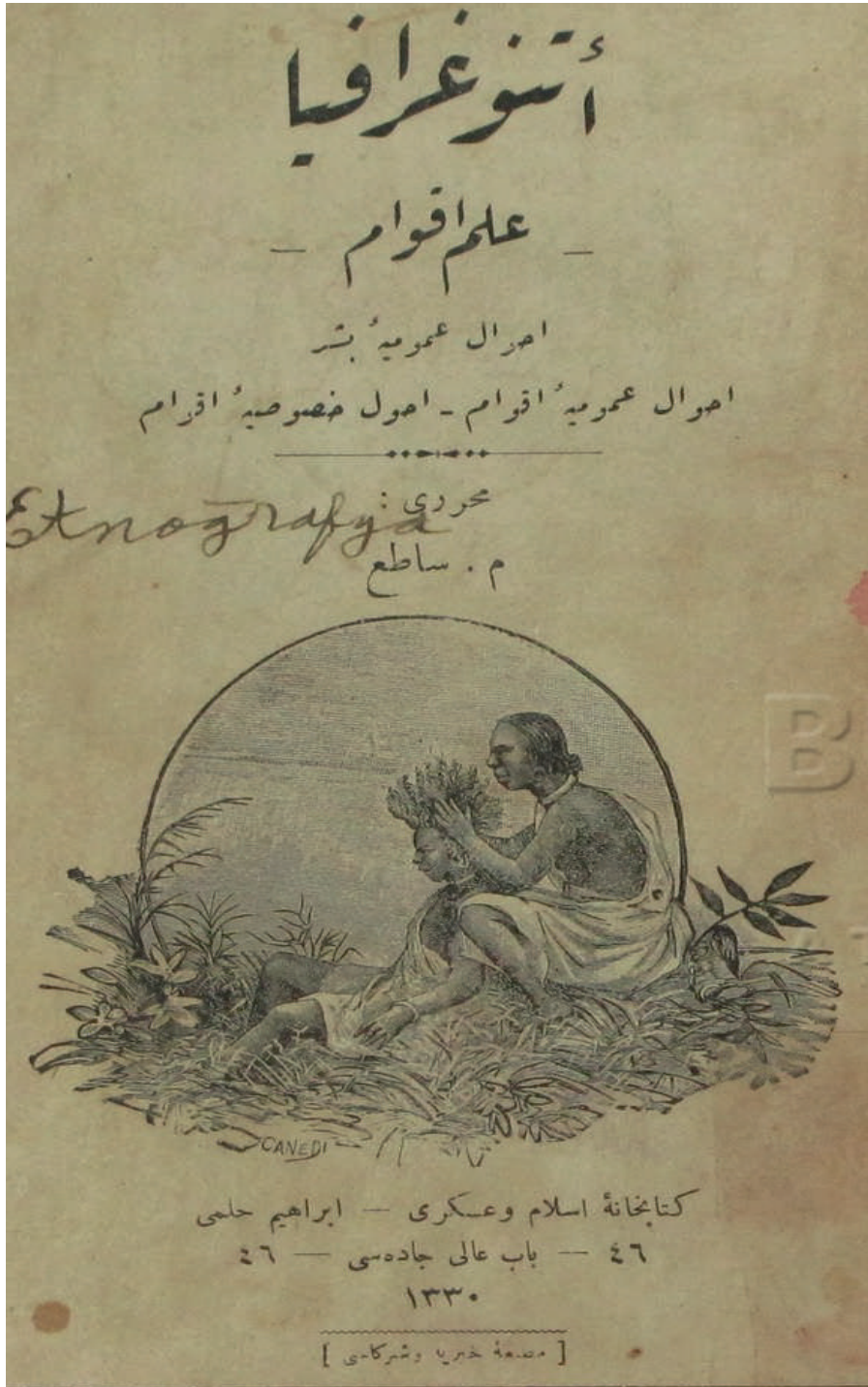
Resim 3- M. Sâti', "Etnoğrafya -İlm-i Akvam- Ahval-i Umumiye-i Beşer, Ahval-i Umumiye-i Akvam, Ahval-i Hususiye-i Akvam" eseri.