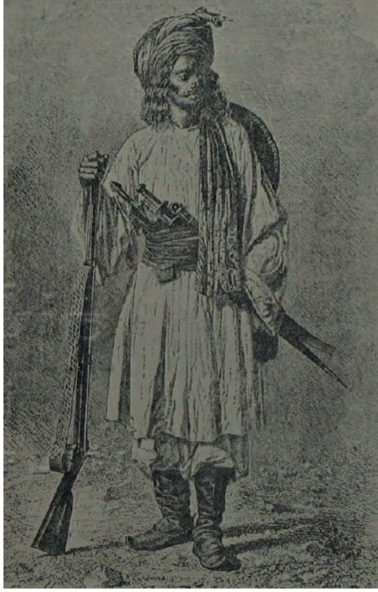
Resim 1-Afşanlı bir savaşı

Eski İraniilere ait en eski eser Avesta isimindeki kitaptır. Bu kitap Zend dilinde yazıldığı için genellikle Zend-Avesta ismi ile zikredilmiştir. Zend-Avesta, Mazdeizm mezhebinin kutsal kitabı olarak görülmüştür. Bu mezhep inancına göre kitap, tanrı Hürmüz tarafından Zoroaster (Zerdüşt) isimindeki bir peygambere muhtevi kılınmıştır.