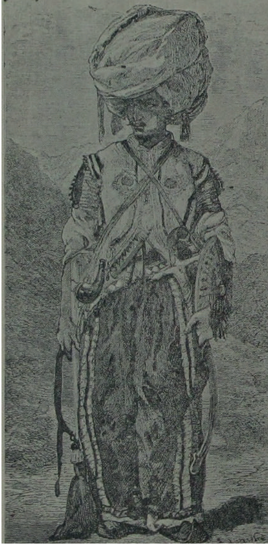
Resim 2- İran'da Yaşayan Bir Küirt

kendi içerisinde bölünmeler yaşamıştır. Bilinen en eski mezhepte ateşe ve toprağa karşı kutsallık atfedilmiştir. Ateşperestlik, Mazdeizm'in bir şekli olmakla beraber tarla açmak, toprağı işlemek de Mazdeizm'e göre bir ibadet ve günahlardan arınma olarak görülmüştür 17 .