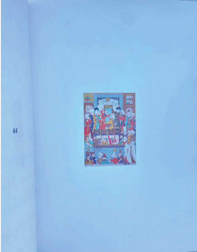
Görsel 2. Bülent Erkmen & Ferit Edgü "Kitap" çalışmasının içerisinde yer alan Firdevsi'nin Şahnamesi adlı eserindeki minyatür.

Erkmen'in tek bir görsel (imge) ile kitap yapma düşüncesi çalışmanın çıkış noktası olmuştur. Bahsi geçen tasarım, tek bir görüntüden yararlanılarak oluşturulmuştur. Bu görsel Edgü tarafından seçilen Firdevsi'nin Şahnamesi adlı eserin bir minyatürüdür. (Görsel 2) "Kitabın görünür öznesi Firdevsi'nin Şahnamesinden bir minyatürken, gerçek öznesi tasarım dilini tersine çeviren bir nesne olan "kitap"dır. Bu kez roller değişmiş metni izleyen tasarım yerine tasarımı izleyen metne bırakmıştır" (Köksal, 1994: 72). İlk olarak Bülent Erkmen minyatürü taratıp parçalarına ayırmıştır ve bu parçalardan bir düzen (maket) oluşturmuştur. Aynı ayrı parçaların kullanılmaları yeni bir ilişki içine girerek Firdevsi'nin eserinden başka bir bütünsel bağlamın oluşmasını sağlamıştır. Ferit Edgü de bu parçalanmış görüntülerin olanağında kitaba metin yazmıştır.