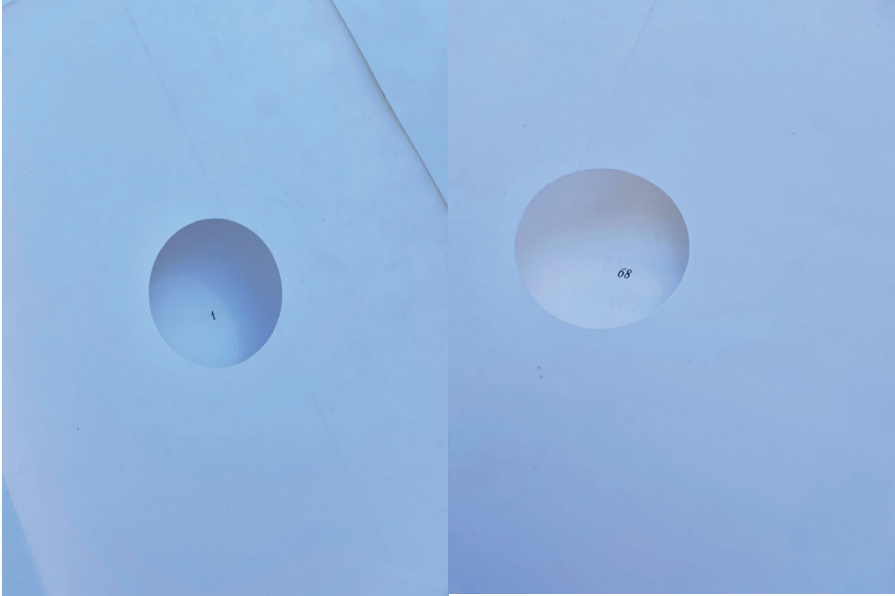
Görsel 4. Bülent Erkmen & Ferit Edgü “Kitap” çalışmasındaki sayfa numaralarının vurgulandığı görseller.

Kullanıcı kitabı açtığı anda ilk olarak içinde yuvarlak boşluk bulunan bir sayfa ile karşılaşmaktadır. Bu boşluğun içerisinden bakıldığında diğer sayfada görülen tek şey bir rakamdır. Bu okuyucuya sayfa numarasını işaret etmektedir. Yani Erkmen bu tasarım fikri ile sayfayı, sayfa numarasına spot ışığı tutarcasına göstermektedir. İlgili çıkarım doğrultusunda hem kullanıcı kitabın başladığını, sanki perdenin aralandığını algılamakta hem de kitabın ve sayfanın kendi varlığına işaret ettiğini çıkarılabilmektedir. Sadece sayfa numarasının yuvarlak delik içinden görünüyor olması perdelerin açıldığı ve sahnedeki oyuncunun ilk anda görülmesi gibi düşünülebilir. Bu durum son sayfada da görülmektedir (Görsel 4). Spot ışığıyla aydınlatılan bir tiyatro oyuncusu gibi sayfa numarasına işaret edilmiştir ve kitap başlamıştır.