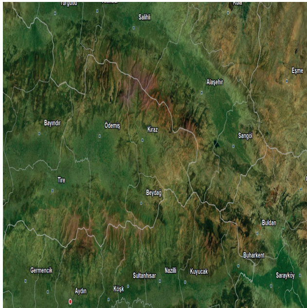
Harita-1: Günümüzde İzmir'e Bağlı Olan Kiraz İlçesi'nin Topografyasını Gösterir Harita