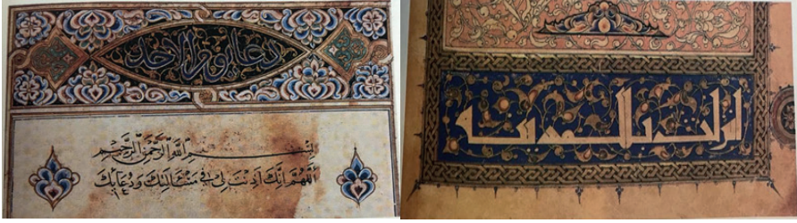
Fotoğraf 3: Selçuklu Dönemi Fasilbaşı ve Beylikler Dönemi Kur'an Zabihesi Detay.

Selçuklu, Mısır Memlûkleri ve Beylikler dönemi tezhibi motif, kompozisyon ve renk özellikleri bakımından birbiriyle benzerlik gösterir. 18 Bu dönemde ortaya çıkan tezyini anlayış daha sonra, klasik Osmanlı tezhip sanatına geçiş için bir hazırlık dönemi olmuştur 19 . XIV. Yüzyıl tezyini eserlerde, geometrik motifler, çok kollu yıldızlar, rûmi, münhani ve bitkisel motifler kompozisyonlarda kullanılmıştır. Hatta münhani motifi ve zencerekle adeta devrin sembolü olmuştur. Beylikler döneminde kullanılan renkler kızıl kahve, siyah, açık lacivert, kırık beyaz ve pembedir 20 .