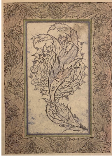
Fotoğraf 8: Şah Kulu'na ait Sazyolu İstanbul Üniversitesi Kütüphanesi, F1426, y47b.

kilin(ch'i-lin) gibi efsanevi yaratıklar, vahşi hayvanlar, kuşlar, periler, hâtayî veya hançer yapraklarına dolanmış kompozisyonlardan oluşmasıdır 48 .