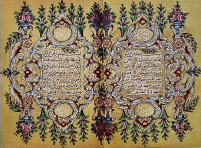
Fotoğraf 11: TYEK. Ankara Yazma Eserler Bölge Müd., Adnan Ötügen İl Halk Kütüphanesi. 06HK4443 Serlevha Tezhibi.

XIX. yüzyılın tezhiplerinde, Barok karakterli Türk rokoku adı verilen ve öncülere XVIII.yy'dan itibaren ortaya çıkan üslup egemen olmuştur 73 . Bu üslubun başlıca motifleri arasında batının akant yaprakları olarak isimlendirdiği iri ve geniş kıvrımlı yapraklar, sepet içinde çiçek buketleri, vazoda çiçekler, kurdeleler, fiyonklar, C ve S kıvrımlı dallar yer almaktadır. Kağıdın boş kalan kısımlarında, tüm zeminin sıvama veya yapıştırma altın ile kaplandığı görülür. Bunların üzeri iğne perdahı ile süslenmiştir 74 .