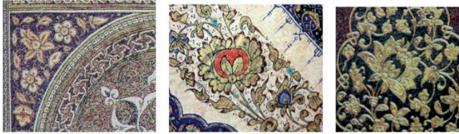
Fotoğraf 6: Beylikler Dönemi ve Fatih Devrine Ait Tezhip, Cilt Kompozisyonlarında Benzerlik Gösteren Hatâyî Motifi

Bu devir tezhiplerindeki desenler incelendiği zaman, motifler içinde bilhassa hatâyînin yaygın şekilde kullanıldığı ve taç yapraklarda içe kıvrılış ve kendi üzerine dönüşlerle adeta üç boyutluluk hissi yaratıldığı görülür. Zengin çeşide sahip bu gösterişli hatâyîler yanında ufak ve sade çizilen, yuvarlak uçlu yapraklar dikkat çekmektedir. Penç çeşitleri içinde yekberk motifi bolca kullanılmıştır. Halkârî denilen gölgeli altın sürme tekniğine, al renkli lâl mürekkebinin ilâve edildiği, yarı şeffaf olan bu mürekkebin, kesif altın zerrelere bulduğu motif uçlarında yer aldığı görülür 33 .