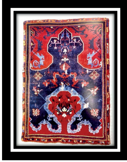
Şekil 2.: Uşak Seccade, 16. Yüzyıl.

Kaynak: (Aslanapa, 2005: 230) Museum of Islamic Art, Berlin.