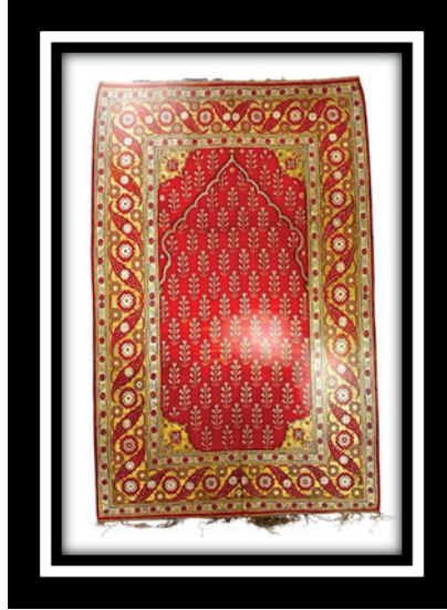
Şekil 3.: Kilim Seccade, 17. Yüzyıl, 200 cm. x 120 cm.

Uşak seccadeleri, 17. ve 18. yüzyıllarda özellikle renk, teknik ve tasarım gibi alanlarda farklılıkların görüldüğü bir dönemdir. Seccadeler hem ülke içinde hem de ülke dışında büyük ilgi görmüştür. Bu yüzyıllarda seccadeler Avrupa'ya ihraç edilmiştir. Özellikle Avrupalı sanatçıların tablolarının arka planında genellikle resmedilmiştir (Atasoy & Raby, 1989: 221). Seccadeler, Osmanlı'da ibadet amaçlı olarak evlerde ve camilerde kullanılmış, aynı zamanda da Osmanlı saraylarında dekoratif ve ihtişamı gösterme amacıyla tercih edilmiştir. Teknik olarak çift düğüm kullanılmıştır. Bu tekniğin kullanılmasının temel nedeni ise dayanıklılığı sağlama ve oluşturulan desenin netliğini göstermesini kolaylaştırmasıdır. Malzeme olarak seccadelerde yüksek kalitede ince ve yumuşak yün kullanılmakla birlikte ipek dokumalar da mevcuttur. Ayrıca doğal boyalardan oluşturulan altın, kırmızı, yeşil, lacivert ve turuncu tonları kullanılmıştır. Kullanılan zengin renkler Avrupa'ya yapılan üretimle ilişkilidir (Rogers, 1986: 98).