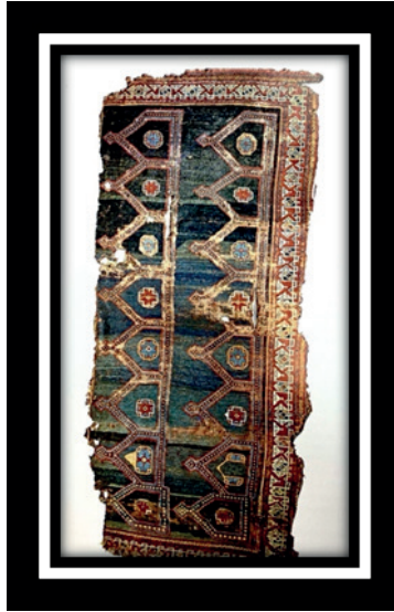
Şekil 1.: Saf Seccade, 15. Yüzyıl, 128 cm. x 311 cm.

genellikle dinsel motifin izlerini taşımıştır. Uşakta üretilen seccadeler sade ve zarif bir yapıda oluşturulmuştur. Seccadelerde Uşak'a özgü olan figürler de kullanılmıştır. Kullanılan figürler, estetiksel bir işleve sahip olmakla beraber o dönemin sosyal ve dini yapısıyla dengeli bir uyumdadır (Raby, 2003). 16. yüzyılda ise Osmanlı'nın sınırlarının genişlemesi ve çok zengin kültürel bir yapıda olması, seccade üretiminde çeşitliliğe neden olmuştur. Bu anlamda Uşak ili bu alandaki en üstün merkez hale gelmiştir. Özellikle Uşak'taki halılar Osmanlı'nın halı desenlerine özgün tarzlarda katkılar vermiştir (Çelik, 2012: 90). Öte yandan bu dönemde çeşitli geometrik desenler ile bitkisel figürler seccadelerde açıkça görülen motiflerdir.