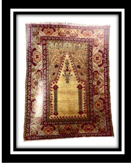
Şekil 5.: Gördes Seccade, 18. Yüzyıl, 144 cm. x 113 cm.