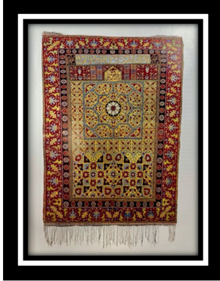
Şekil 6.: Halı Seccade, 19. Yüzyıl İkinci Yarısı, 149 cm. x 104 cm.

ettikleri desenler ön planda olmuştur (Walker, 1998: 56). Bu bağlamda çiçek, yaprak ve geometrik desenler sıklıkla tercih edilmiştir. Ayrıca doğal boyaların kullanımı oldukça azalmış, bunun yerine kimyasal boyaların kullanımı artmıştır. Bu durum geleneksel renk tonlarının yok olmasına sebep olmakla birlikte renklerin parlaklığını arttırmıştır (Öney, 1971: 89). Aynı zamanda üretim tekniklerinde de değişim yaşanmıştır. El dokuma yerine makine üretimine geçilmiştir. Fakat geleneksel üretim teknikleri de koruma altına alınmış ve Uşak seccadelerinin üretimi için teşvikler yapılmıştır. 19. yüzyılda Uşak seccadelerinde düşük kalitede olan yünler kullanılmıştır. Bu anlamda seccadelerin uzun süren dayanıklılığını ve dokusal niteliğini olumsuz etkilemiştir. Bunun oluşmasındaki temel etken Batı pazarındaki düşük maliyet taleplerini karşılama isteğidir (Aslanapa, 1987: 188).