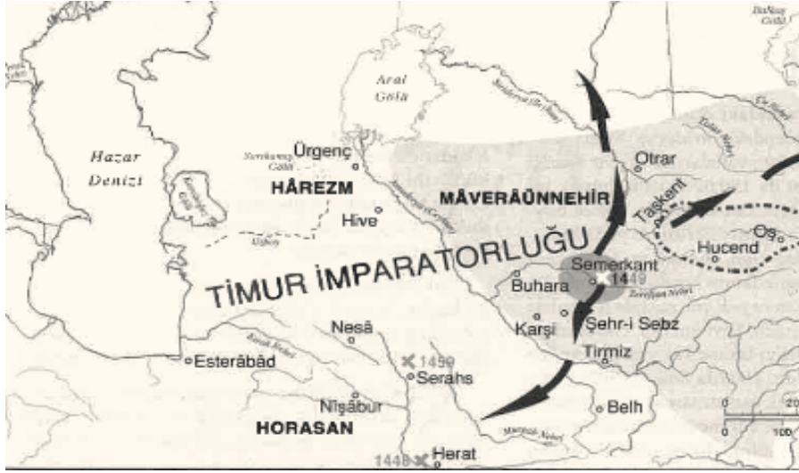
2. Harita (Abazov, 2022; 26. Harita)

14. yy. Timur Devleti'nin dağılma yıllarında Ceyhun Nehri'nden beslenen bu kolun artık Ceyhun Nehri'nden beslenmediği görülmekte.