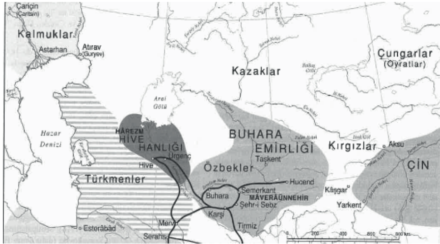
3. Harita (Abazov, 2022; 29. Harita)

14. yy. Timur Devleti'nin dağılma yıllarında Ceyhun Nehri'nden beslenen bu kolun artık Ceyhun Nehri'nden beslenmediği görülmekte.