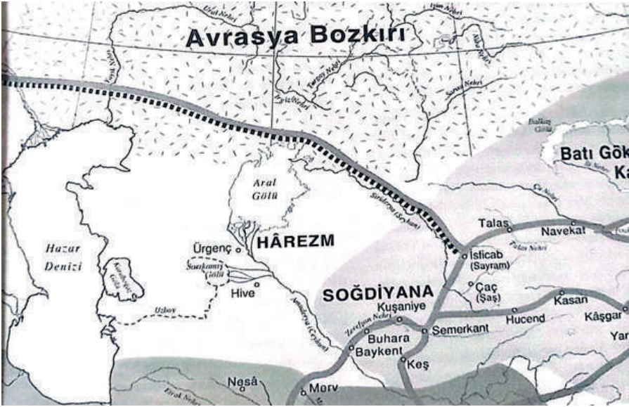
1. Harita (Abazov, 2022; 14. Harita)

7. yy.'da Ceyhun'un Hazar Denizi'ne akan bir kolu haritada görülmektedir.