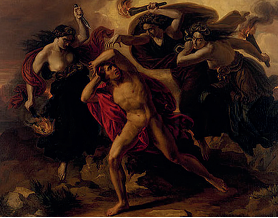
Görüntü 16: Erinys'ler.