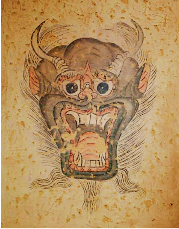
Görüntü 10: Kurgan üzerinde yer alan Erlik Han illüstrasyonu.

Bir diğer şeytan tasviri ise Türk mitolojisinde yer alan Erlik Han çizimleri ve Mehmet Siyah Kalem’e ait olan Demonlardır . Erlik Han yeraltı aleminin tüm idaresini elinde tutan ve kötücül bir tanrıdır. Gök ruhu Ülgen tarafından önce yeryüzüne sonra da yeraltına sürülmüştür (Görüntü 10). Canavarlar, kötü ruhlar ve kötü tanrılar hep bu yeraltı aleminin yaratıkları olarak konumlanırlar. Erlik Han da kötücüdür ve etrafında hep bu kötü karakterler yer almaktadır (Bilgili, 2022, s. 16). Bilgiliye göre, ejderhalar, yılanlar, akrepler, balıklar, kurbağalar yeraltı hayvanlarıdır ve Erlik Han ile doğrudan bağlantılıdır.