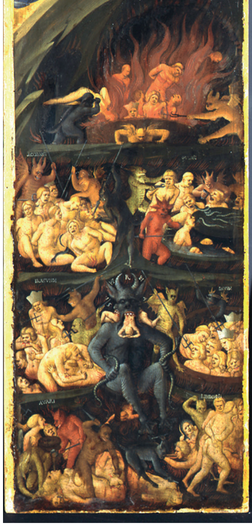
Görüntü 4: Fra Angelico “Son Yargı” 15.yy.

Burada bahsedilen kükürtle yanan ateş gölüne diri diri atılmaktır. Bunun dışında bir diğer ifade ise; “ Ama gökten ateş indi ve onları yiyip yuttu. Onları kandıran iblise gelince, ateş ve kükürt gölüne atıldı. Canavarla yalancı peygamber de oradalar. Çağlar boyu gece gündüz işkence çekecekler (İncil, 1998, s.525). Fra Angelico’nun 15. yy.’da yapmış olduğu Son Yargı triptiğinin son panosunda, ceza çeken günahkarları ve tam ortasında oturan üç ağızlı dev şeytani resmetmiştir. Şeytan ve kendisine yardım eden iblisleriyle birlikte günah işleyenleri alevler içerisinde yakmış ve üç ağızla günahkarları yiyerek öğütmüştür. Resmedilen cehennem sahnesi bir hayli ürkütücü ve uyarı niteliğindedir (Görüntü 4).