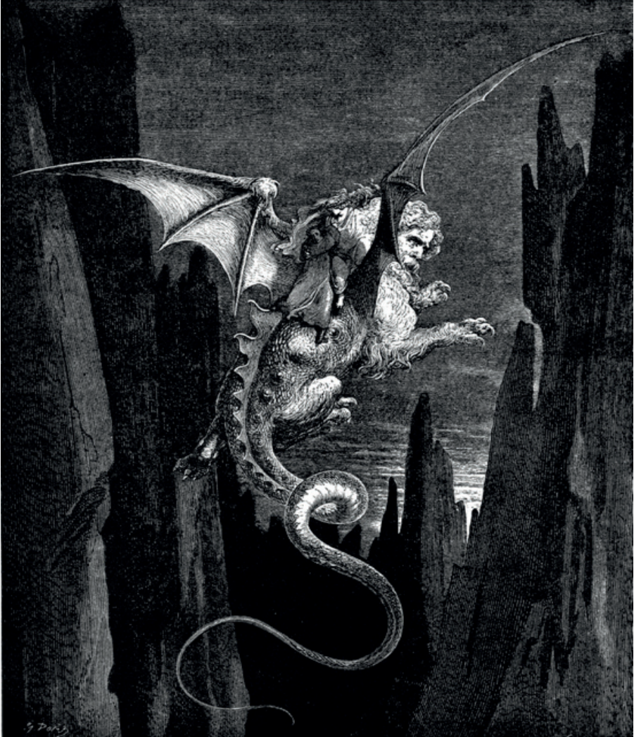
Görüntü 14: Gustave Doré, "Geryon"

Geryon lar, üç başa, altı adet kola ve üç adet vücuda sahip bir titan olduğu söylendiği gibi, insan yüzlü ve ejderha gövdeli, pençeleri olan cehennemin diğer başkalaşım içerisindeki ifritlerindedir. Yüzü insan sureti olarak görünse de vücudu tamamen metamorfoz bir hayvan biçimindedir. Dante, Cehennem Kantoları 'nda pek çok habis ifritle karşılaştığını aktarırken Geryon 'a da yer vermiştir (Görüntü 14).