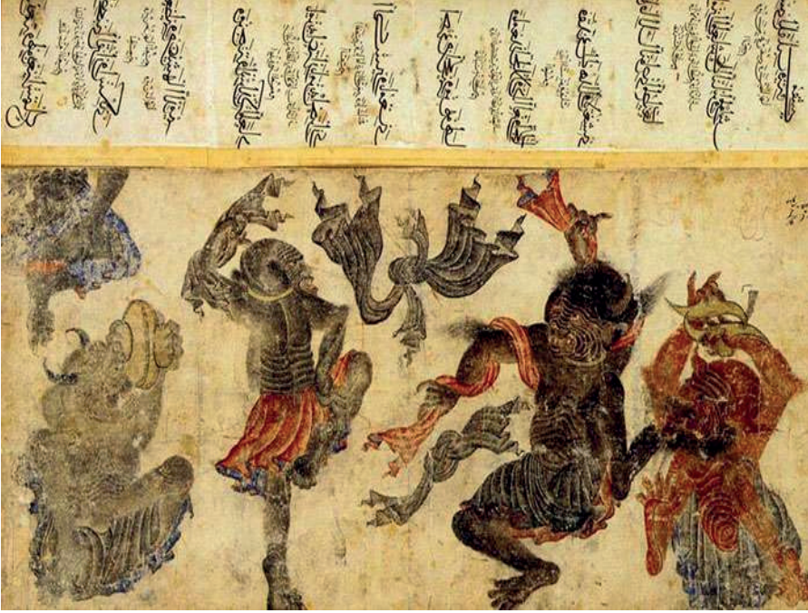
Görüntü 11: Mehmet Siyah Kalem, “Demonların Dansı”.

Şeytan ve Erlik Han ile doğrudan ilişki kurulabilecek bir diğer karakter ise Mehmet Siyah Kalem’in 16. yy’da resmetmiş olduğu şeytan (demon) çizimleridir (Görüntü 11). “ Bu dünyanın merkezinde boynuzları, postları ve korkunç yüzleriyle demonlar yer alıyor. Hayvan- demon karışımı bu yaratıkların kuyrukları ya at kuyruğuna benziyor ve aşağı sarkıyor ya da Kaplan kuyruğu biçimi alıyor ve yumru gibi bir ejderha kafası bulunuyor ” (İrak, 2018, s.72).