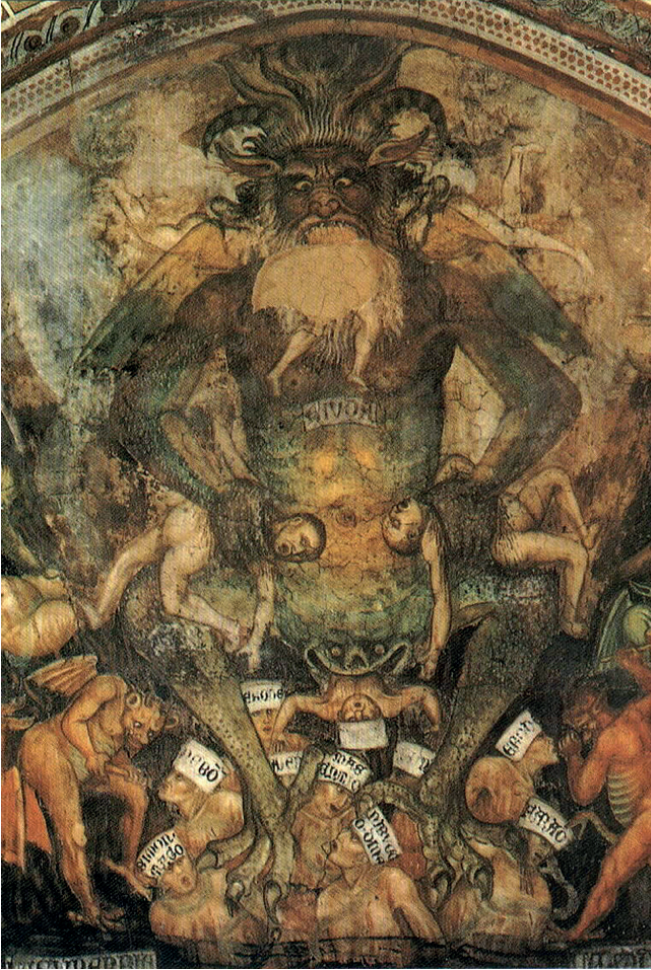
Görüntü 9: Taddeo di Bartolo “Son Yargı”.

Şeytan hiç beklenmedik bir şekilde beliren doğüstü olarak kabul edilen bir varlıktır. Korkutucu, öngörülemez ve irrasyoneldir. Tanrı kapsayıcı ve bütüncül bir yapı sergilerken, şeytan belirsiz bir güç olarak konumlanmıştır. Şeytan imgeleri pek çok farklı kaynakta neredeyse benzer unsurlara işaret etmektedir. Boynuzları, sert kılları, sakalları, toynakları olan habis canavarlar peygamberlere ve din adamlarına zulüm gösterir, Dante’nin cehenneminde sonsuza kadar derin ateşte ve acılar içerisinde yakar kavururlar. Giovanni da Modena’nın Son Yargı Cehennem (Görüntü 8) panelinde görülen Şeytan, günahkarların çukuruna atılmış olanları yer, yutar ve diğer iblislerle birlikte eziyet eder. Taddeo di Bartolo Son Yargı isimli cehennem ve cehennem ifritlerine yer verdiği resmi de diğer cehennem resimleriyle benzer şekilde ifade edildiği görülmektedir (Görüntü 9).