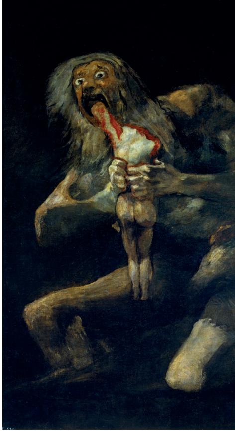
Görüntü 12: Goya, “Çocuğunu yiyen Kronos”.

karşısında yer alsa da aslında o da izleyicisi için estetik bir haz uyandırır. Önceki başlıklarda ölümden sonrasını, yeraltı dünyasını oluşturan, doğrudan bu imgeyi zihnimize uyandıran cehennemin görüntüsüne ve iblislerine yer verilmişti. Şeytanlar, cinler veya şeytana atıf yapan farkı kültür içerisindeki isimlendirmeler vardı. İfritler ve tekensizler başlığı altında ise mitlerde, anlatılarda yer alan Kronos gibi kötü tanrıların, cehennemin habisi, ifrit ve yaratıklarına yer verilmiştir.