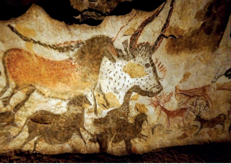
Görüntü 1: Lascaux Mağarası. Vézère Vadisi'nin Prehistorik Döneme ait mağara resimlemeleri

“Bu resimler bugün Afrika’daki avcı kabilelerin hala uygulamakta olduğu bir av büyüsünü hatırlatıyor. Resimlenmiş hayvan bir ‘duble’ işlevi görmektedir. Avcı onun sembolik katliyle asıl hayvanın ölümünü önceden görür ve garanti altına alır. Bu, bir resimde temsil edilen dublenin ‘gerçekliğine’ dayanan bir tür duygudaşlık büyüsüdür: resme ne olursa orijinaline de o olacaktır. Altta yatan psikolojik olgu, canlı bir şeyle o varlığın ruhu olduğu düşünülen imajı arasında güçlü bir özdeşleşmedir. İlkel insanların pek çoğunun fotoğraflarının çekilmesinden hoşlanmamalarının bir nedeni de budur” (Jaffe, 2018, s.231).