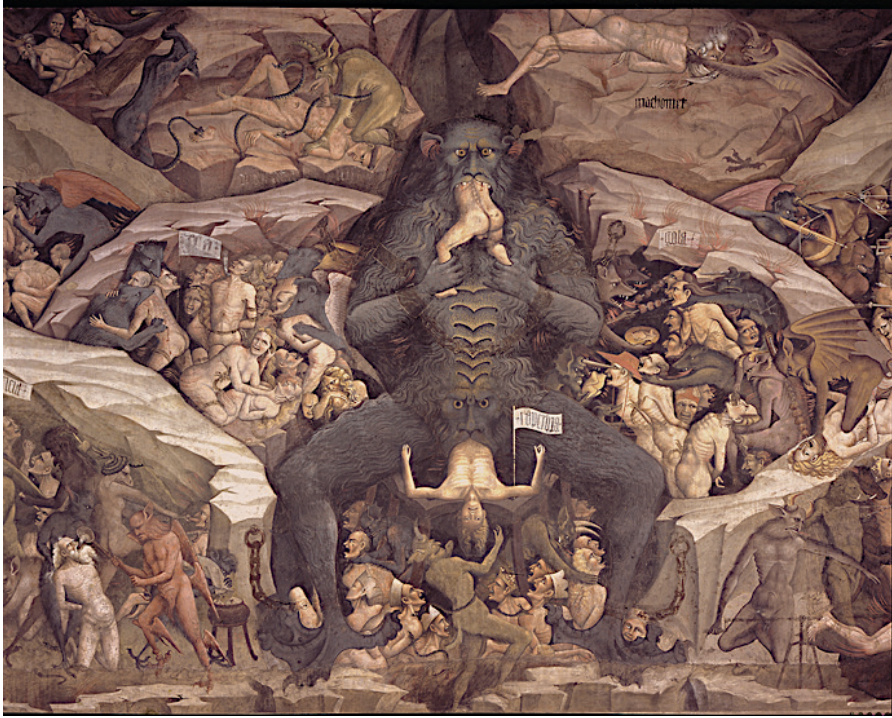
Görüntü 8: Giovanni da Modena “Son Yargı ve Cebennem”, 15. yy., Bolognini Şapeli.

Pagan dönem inanç uygulamaları, semavi dinlerin dünya üzerinde yaygın şekilde kabul görmesinden sonra kötü görülmüş ve doğa tanrılarına atıf yapan imgeler şeytanlaştırılmıştır. Yunan mitolojisinde yer alan keçi ayaklı ve keçi boynuzlu, tarlaların ve çobanların koruyucusu olarak anılan Pan zaman içerisinde şeytan imgesiyle özdeşleşmeye başlamıştır. Burada en önemli unsur olarak yer alan ise; şeytan tasvirlerinde keçi imgesinin sık sık kullanılmaya başlanmasıdır. Zamanla keçi kötülüğü simgeleyen ve kötülüğün yerine geçen bir görüntü olarak kabul görmüş ve dini el yazmalarında, anlatılarda, tasvirlerde sakallı ve boynuzlu şeytanlar kullanılmıştır. Bu tarz yaratık imgelerinin hepsinde hayvan suretleri ve korkunç bir başkalaşım vardır. İnsanların en büyük korkularıyla beslenerek, karanlık ve bilinmezlikle özdeşleşmiş bu habis yaratıklar ölümün, kötülüğün, cennetten kovulmanın verdiği öfkeyi sembolize ederek çirkinliği ve öteki olmayı anlatır (Wilkinson, 2021).