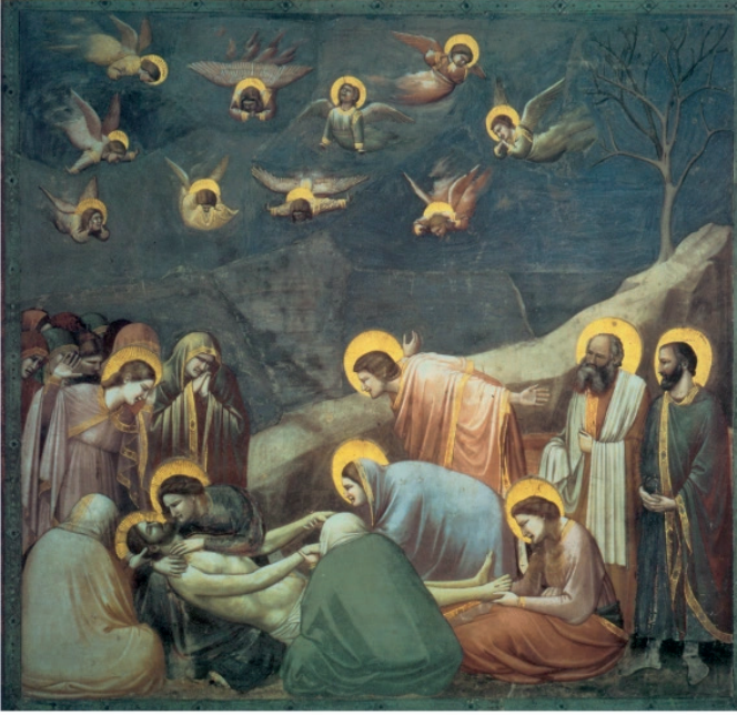
Görüntü 3: Giotto, “Ağır”

Vergilius gibi yazarlar, şairler derin bir düş gücüyle insan aklının sınırlarını zorladığı tanımlamalar yapmışlardır. Özellikle kutsal metinlerden yola çıkan ressamalar, heykeltıraşlar, mimarlar Tanrı’ya ulaşmak için göksel kiliseler, heykeller ve resimlemeler yapmış, bu yolla dinin yüceltilmesi ve iyi bir dindar olmak adına Cennet ve Cehennem illüstrasyonları inananlar için önemli bir yol gösterici olmuştur. Dini duyguları harekete geçirecek heykellerin ve resimlemelerin yaygınlaşmasıyla inananlara vad edilen cenneti ve ödülleri aktaran ihtişamlı resimlemeler bir hayli fazladır.