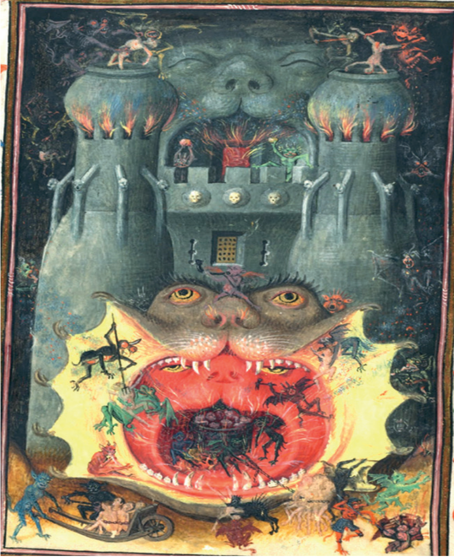
Görüntü 5: Hours of Catherine of Cleves

Günahkarların gözyaşı, diş gıcirtısı, ebedi ateş gibi tasvirlerle çektikleri acı cehennemi tanımlayan ve belirgin bir görüntü sunmayan ifadeler Vahiy bölümünde sıkça yer almaktadır. Hours of Catherine of Cleves adlı el yazması dua kitabının cehennemle ilgili olan kısmında aslana benzeyen büyük bir şeytan, ağzını açmış ve içeride başka bir iç ağız daha açılarak kızıl alevler saçtığı illüstre edilmiştir (Görüntü 5). Dışarıda pençeli iblisler günahkarları fırına benzeyen cehennem çukuruna atarlar. Resmin üst kısmında yer alan kurukafalarla süslenmiş ölüm kalesinin önünde başka bir ağız daha