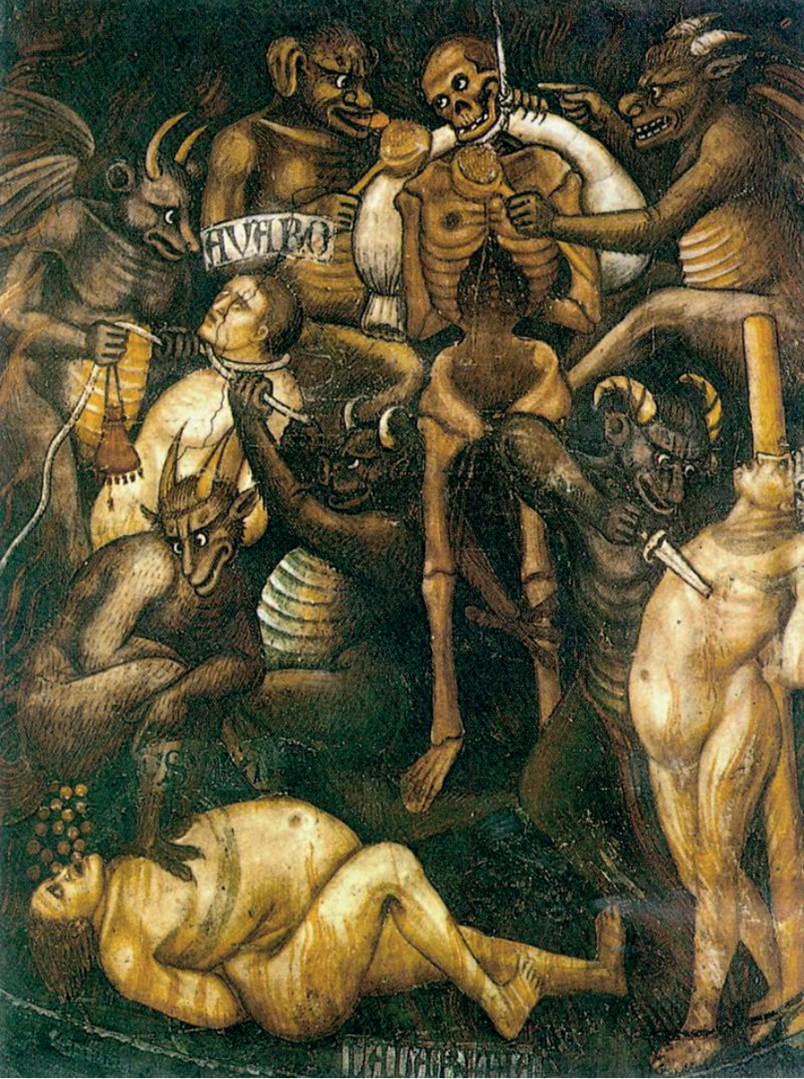
Görüntü 6: Taddeo di Bartolo "Son Yargı"

görülmektedir. Burada yine günahkârlar eza görmekte ve iblisler de bu işkenceye yardım etmektedir.