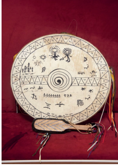
Görüntü 2: Şaman Davulu

Erken dönem insanının gerçeğe ulaşma çabasıyla yarattığı ritüeller, sonraki zamanlarda inanç sistemi gelişip, farklı isimlendirmeler ve uygulamalarla değiştikçe hem büyüsel amaçlı hem de tanrılara hesap verme güdüsüyle mağara duvarlarından tapınak ve mimari alanların yüzeylerine aktarılarak varlığını devam ettirmiştir. Mısır ve Mezopotamya uygarlıklarında yer alan ritüeller, uygulamalar, Tanrı yolunda yapılan ve günlük hayatın akışında gerçekleşen olayları anlatan illüstrasyonlar karşımıza çıkmaktadır. Bu aktarımların kendi stilize üsluplarında çeşitli konu çerçevesinde ele alındığı görülmektedir.