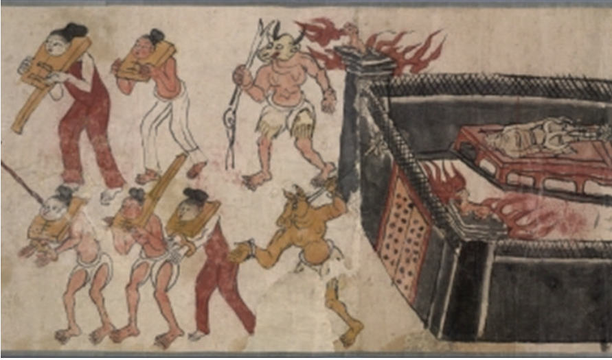
Görüntü 7: Erlık Han 'ın evini gösteren Cehennem Tasviri.

dönemin illüstrasyonlarında kötücül ve habis olarak ifadelendirilirler. “Bu görünüm, Hristiyan imgelemine nasıl bir sıra yaratıklar ve korkunç olaylar dağarcığı soktuğu açıktır” (Eco, 2015, s.76), (Görüntü 6).