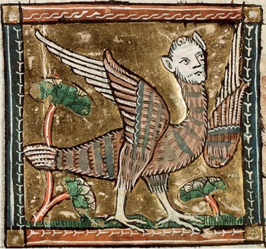
Görüntü 15: Harpia

“İğrenç dalavereci yanımıza geldi, başıyla gövdesini gösterdi, ama kuyruğunu kıyıya çekmedi. Yüzü dürtüst insan yüzü gibiydi, yanıltıcı bir uysallık içindeydi, yılan vücuduydu vücudunun geri kalanı; koltuklarına dek kıllı iki pençesi vardı, sırtı, göğsü, iki yanı renkli yumrularla, halkalarla kaplıydı. ... Kuyruğu boşlukta sallanıyordu, kuyruğun akrep zehirli çatal yukarı doğru kıvrılıyordu” (Dante, 2010, s.148, Cehennem XVII. Kanto).