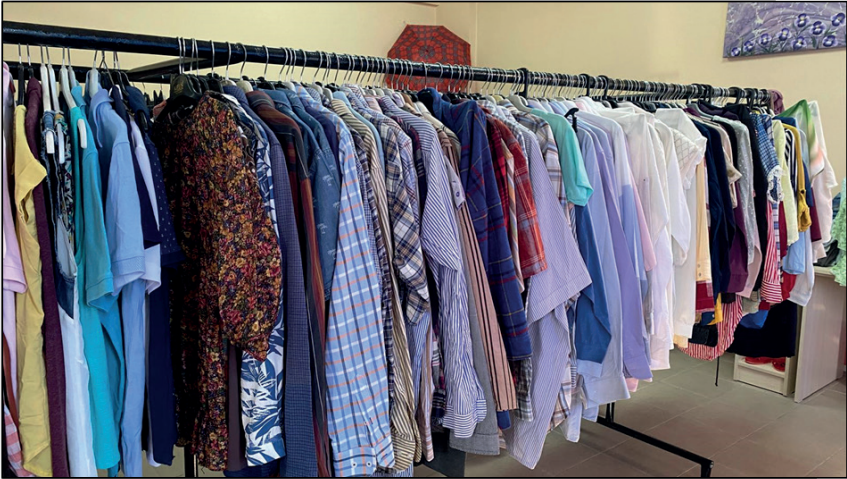
Resim 3. Sosyal Market Giysi Başışları