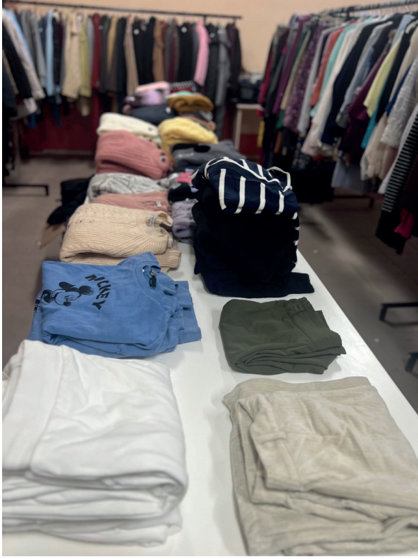
Resim 2. Sosyal Market Giysi Başışları