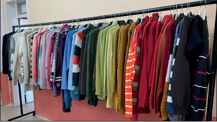
Resim 1. Sosyal Market Giysi Bağışları

Projenin uygulanmasında bağış ve katılım süreci, yardım kuruluşları, markalar ve ilçe esnafı ile doğrudan iletişim kurularak sağlanmaktadır. Projenin görünürlüğü arttıkça, yardım kuruluşlarının sosyal market faaliyetlerine olan ilgisi de artmış ve bu durum bağış miktarlarına olumlu yansımıştır. Sosyal marketin görünürliğini artırmak amacıyla, projeye ilişkin faaliyetler üniversite ve meslek yüksekokulu internet sayfalarında haber olarak yayımlanmaktadır. Ayrıca, sosyal medyada varlık göstermek için @dolabimdolabinolsun kullanıcı adıyla bir Instagram hesabı açılmıştır. Projeye ait www.dolabimdolabinolsun.com adresinde bir internet sitesi de bulunmaktadır. Resim 1.-Resim 6'da, sosyal markete ilişkin görseller yer almaktadır.