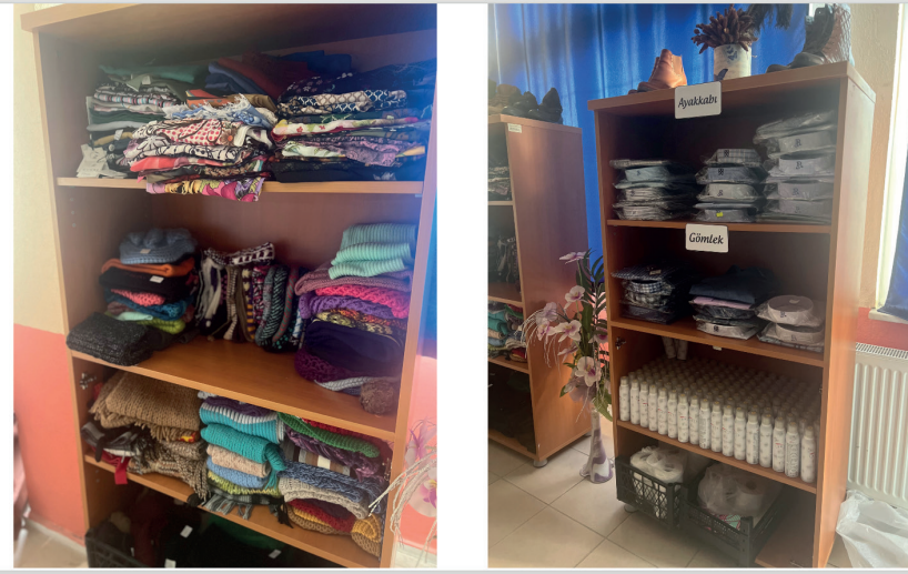
Resim 5. Sosyal Market Giysi Bařışları