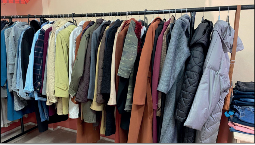
Resim 4. Sosyal Market Giysi Bařışları