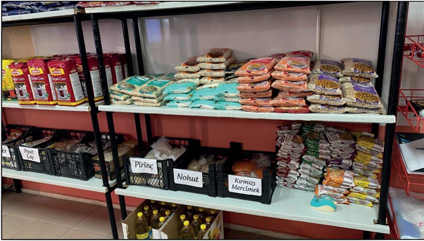
Resim 6. Sosyal Market Gıda Bağışları

Sosyal marketin etki ve başarı ölçütleri için sağlanan desteklere ilişkin envanter kayıtları tutulmakta, ürünler hizmet teslim fişleriyle öğrencilere teslim edilmektedir. Bu teslim fişleri bilgisayarlı muhasebe paket programına işlenmektedir. Böylece, sosyal marketin işleyişine ilişkin şeffaflık ve hesap verilebilirlik sağlanmış olmaktadır. Hizmetten faydalanan öğrencilerin memnuniyetini ve hizmet kalitesi algılarını ölçmek amacıyla anketler uygulanmakta ve bu sayede eksikliklerin giderilmesine yönelik gerekli düzenlemeler yapılmaktadır.