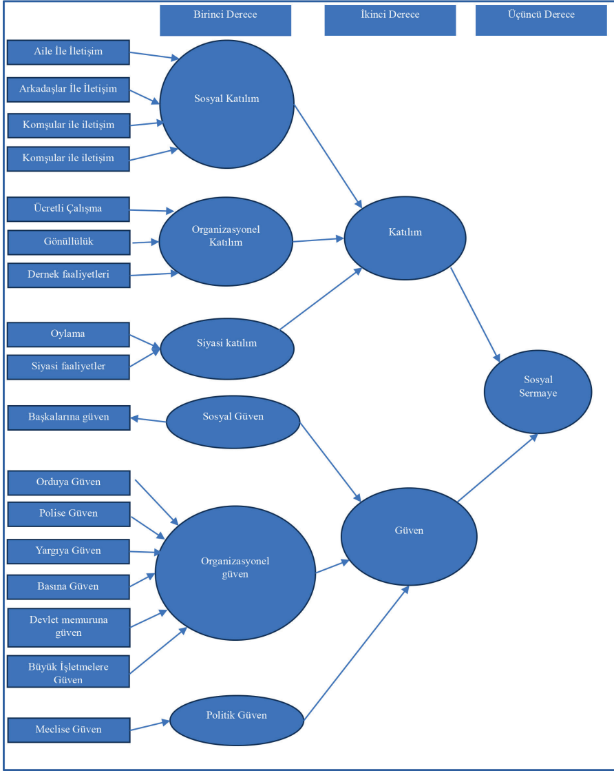
Şekil 1.1. Sosyal Sermayenin Organ Bağışçılığı Üzerine Etkisi