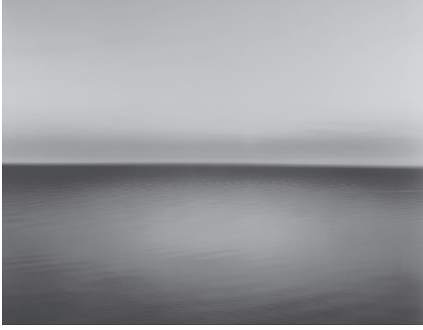
Şekil 6. Hiroshi Sugimoto, Boden Denizi, Uttwil, 1993.