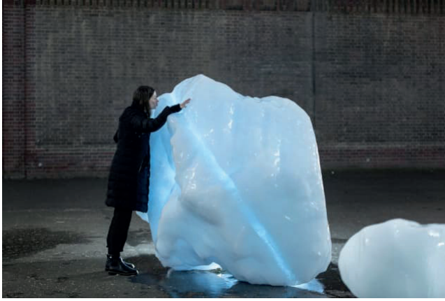
Şekil 1. Olafur Eliasson, Ice Watch (Buz Nöbeti), 2014.

Eliasson'un çalışmaları, doğaya ait bir parçayı doğrudan sergileyerek, insanların çevreyle olan bağlarını güçlendirmeye ve iklim krizine karşı daha duyarlı bir bakış açısı geliştirmeye teşvik etmektedir.