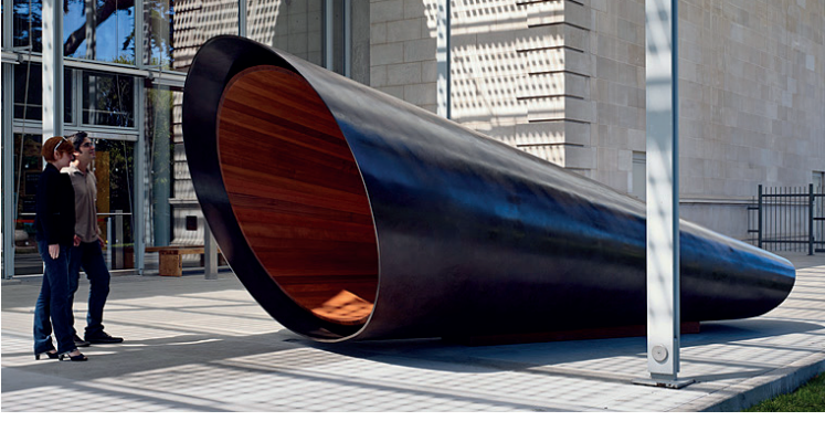
Şekil 3. Maya Lin, What is Missing? (Ne Eksik?), 2009.

belgelemeyi amaçlamaktadır. Eser, türlerin şu anki altıncı büyük yok oluşu hakkında bilim temelli sanat eserleri aracılığıyla farkındalık yaratmak ve yaşam alanlarını onararak karbon emisyonlarını azaltabileceğimizi hem de türleri koruyabileceğimizi vurgulamak temelli yaratılmış çok mekanlı bir anıt modellemesidir. Bu amaçla, izleyicilere doğanın değişimlerini ve kayıplarını düşünme fırsatı sunmaktadır. Lin'in çalışması, sanal ortamda sunulması sayesinde çok daha geniş bir kitleye ulaşarak, çevresel bilinci artırmayı hedefler ve doğayla uyumlu bir gelecek için kolektif sorumluluğu hatırlatır