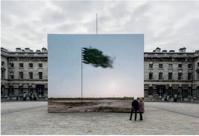
Şekil 5. John Gerrard, Western Flag (Batı Bayrağı), Londra, 2017.

Flag” adlı çalışması, dijital ortamda oluşturulmuş bir video enstalasyondur. İlk kez 2017’ de Londra’daki Somerset House’un avlusunda bir ay boyunca büyük ölçekli bir led ekran heykeli olarak sergilenmiştir. Petrol endüstrisinin yıkıcı etkilerini ele alan bu video, ABD’deki ilk petrol kuyusunun bulunduğu yere dijital olarak yerleştirilmiş bir karbon bayrağını gösterir. Kara dumanla kaplanmış bu bayrak, fosil yakıt kullanımının çevre üzerindeki tahribatını sembolize ederken bir uyarı niteliğindedir. Gerrard’ın pratiği, iklim krizine sebep olan endüstriyel faaliyetlerin görünmez boyutlarını gözler önüne sererken, izleyiciye petrol bağımlılığının sonuçlarını düşündürmeyi amaçlar.