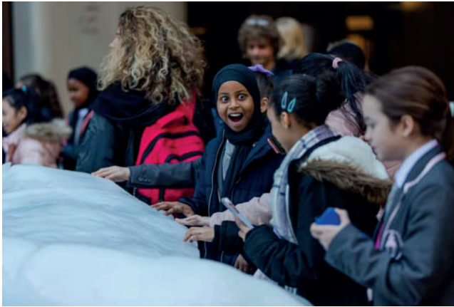
Şekil 2. Olafur Eliasson, Ice Watch (Buz Nöbeti), 2014.

Bir diğer sanatçı Maya Lin "What is Missing?" (Ne Eksik?) adlı projesiyle, iklim değişikliği ve biyolojik çeşitlilik kaybı gibi çevresel meseleleri gündeme taşır. Şekil 3'de görülen çalışma, ilk kez 2009'da yayınlanan ve ziyaretçilerin videoları ve sesleri keşfetmesi, türler ve habitat kaybı hakkında bilgi edinmesi ve geleceğin gidişatını değiştirmenin yollarını bulması için devam eden bir etkileşimli projedir (Macaulaylibrary: 2017). Sanal bir bellek alanı olarak kurgulanan bu projede Lin, iklim değişikliğinin ve insan müdahalesinin dünyadaki ekosistemler üzerinde yarattığı yıkımı