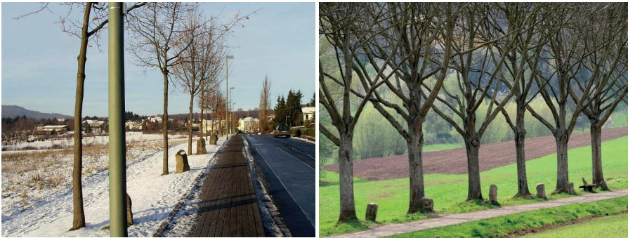
Görsel: 3- Görsel: 4 Joseph Beuys, 7000 Meşe, Kassel, 1982