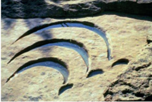
Görsel: 12 Lynne Hull, “Serpilmiş (Scatter)” 1987