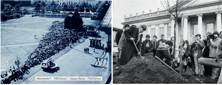
Görsel: 1 - Görsel: 2 Joseph Beuys, 7000 Meşe, Kassel, 1982

Beuys bu projeye ayrıca, endüstriyel kirlenme sonucunda, soyu tükenen codoicea maldivica ve cocus nucifera isimli ağaçlara da gönderme yapmıştır. Tüm Kassel şehrini içine alan projeye vurgulanan bir diğer nokta, gezegenin, ekosistem bütünlüğü tahrip olmaya devam ederse yaşamdaki ortak mutluluklar da engellenecektir. Ağaç ve taş birer nesne olarak, hem geçmiş zaman hem de gelecek zaman kavramı bakımından yeryüzü ile bağlantıları vurgular. Bazalt taşı, yerkürenin içindeki akışkan magma tabakasının katılması ile gezegenin geçmişine bir gönderme niteliğindedir. Buna karşılık olarak meşe ağacı ise, sürekli gelişim içinde olması ve organik yapısıyla, geleceği simgeleyen bir nesnedir. Özetle bu çalışmada geçmiş ve gelecek bir aradadır. Bu proje 5 yıl boyunca halkın da katılımıyla devam etmiştir (URL 1).