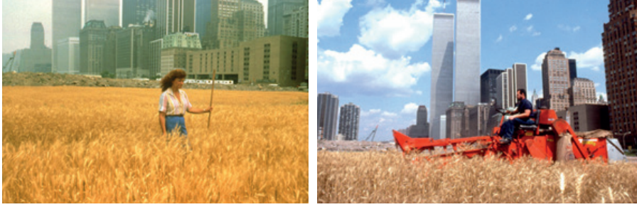
Görsel: 8- Görsel: 9 Agnes Denes, Buğday Tarlası—Bir Yüzleşme, New York, 1982

etmektedir. Sanatçı bu araziye buğday ekerek ise kötü yönetimi, israfı, dünya açlığını ve ekolojik kaygılara atıfta bulunmayı hedeflemiştir. Eleştirilenler tarafından oldukça şaşırtıcı ve etkileyici bulunan çalışma sanatçının en çok bilinen çalışmalarından biridir (URL 2).