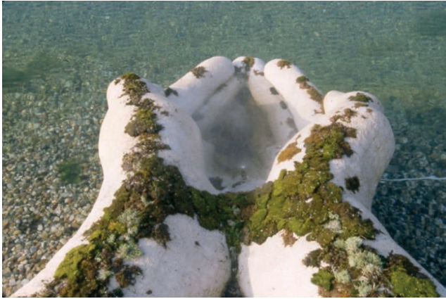
Görsel: 14 Jackie Brookner The Gift of Water, Moss Concrete 0.91 x 1.52 x 2.59 Metre, Grossenhain, Germany, 2001