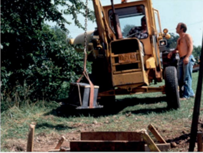
Görsel: 7 Agnes Denes, Rice/Tree/Burial, Sullivan Country, New York, 1968

1982 yılında ise “Buğday Tarlası—Bir Yüzleşme” adlı çalışmasını gerçekleştirmiştir. Çalışma için New York’ta Wall Street ve Dünya Ticaret Merkezi yakınlarında bulunan Battery Park’ta moloz yığınlarının bulunduğu iki dönüm araziyi kullanmıştır. Arazi üzerine Mayıs ayında buğday ekmiştir, ancak bu ekim işleminden önce araziyi ıslah etmek için 200 kamyon dolusu toprak getirilerek bölgeye yayılarak toprak ıslah edilmiş ve ardından buğday tohumları ekilmiştir. Ağustos ayında ise büyüyen buğdaylar hasat edilmiştir. Hasattan elde edilen buğdaylar tohum olarak dünyanın pek çok yerine gönderilmiştir (URL 3). Değeri 4,5 milyar dolar olan moloz yığınlarının olduğu arazi Denes’e göre enerjisi, dünya ticaretini ve ekonomiyi temsil