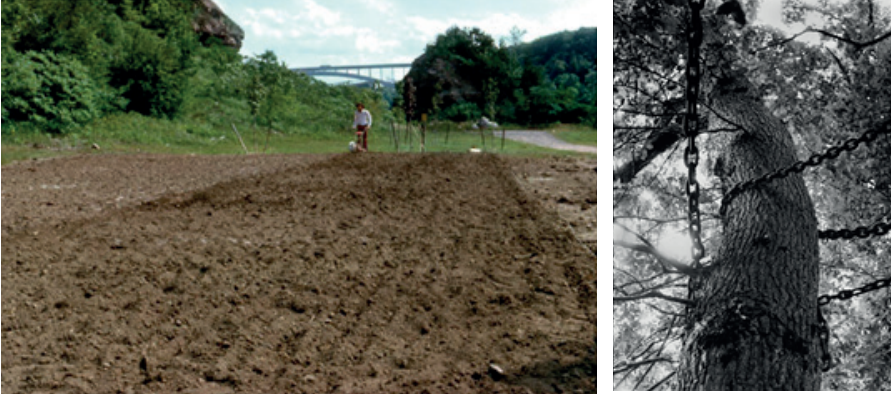
Görsel: 5 - Görsel: 6 Agnes Denes, Rice/Tree/Burial, Sullivan Country, New York, 1968