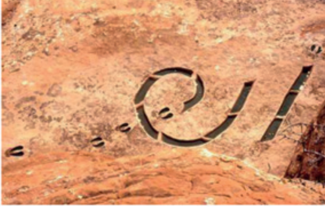
Görsel: 11 Lynne Hull, “Su Birikintisi Yazısı 1 (Hydroglyph 1)” 1985