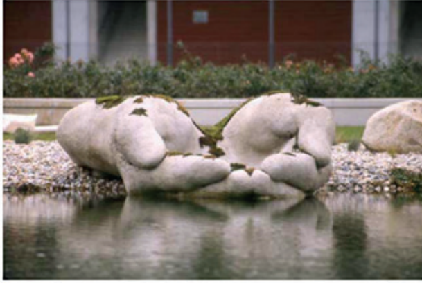
Görsel: 13 Jackie Brookner The Gift of Water, Moss Concrete 0.91 x 1.52 x 2.59 Metre, Grossenhain, Germany, 2001

Brookner'in "The Gift Of Water" adlı çalışması ekolojik sanatın önemli örneklerinden biridir. Çalışma Almanya'da Grossenhain da bulunan halka açık bir havuzda gerçekleştirilmiştir. Klor veya başka herhangi bir kimyasal kullanılmadan havuzdaki su, suya eklenen sulak alan bitkileri ve yosunlarla birlikte filtrelenmiştir. Çalışmada kıydan gölete uzanan iki büyük el vardır. Bu eller yosunları tutmakta ve bir çeşme ile üzerinden akan su ellerin arasından akarken hem havalanmış hem de yosunlarla temizlenmiş, arıtılmış suya dönüşmektedir. Böylelikle çalışma doğal bir su arıtma sistemine dönüşmüştür. Bu sistemde bir organizmanın "atığı" bir diğeri için yiyecek olmaktadır. Su heykellerin üzerinden akarken, bitkiler ve bakteriler, sudaki kirleticileri ve toksinleri, yaşamı sürdüren besinlere dönüştürür. Atık sular filtreleme işleminin ardından balıklar, salyangozlar ve suda yaşayan diğ er su organizmalar için bir yaşam alanı oluşturur (URL 4).