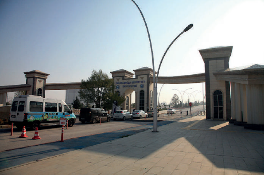
Fotoğraf 28: Karamanoğlu Mehmetbey Üniversitesi giriş kapısı. Ahmet Özpmar.

2007 yılında üniversitenin kurulmasının ardından Karaman'da yaşanan en önemli mekânsal dönüşümlerden biri I. İstasyon Caddesinde gerçekleşmiştir. I. İstasyon Caddesi geçmişten günümüze Karaman'ın önemli arterlerinden biridir ancak üniversite kurulmadan öncesi ve sonrası arasındaki fark görüşmecilerin pek çoğu tarafından üzerinde durulmuş bir olgudur. Yani I. İstasyon Caddesinin Karaman için önemi, üniversite açıldıktan sonra daha da artmıştır.