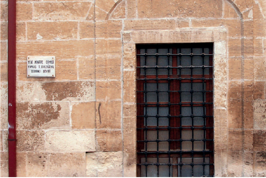
Fotoğraf 15: Osmanlı devrinde inşa edilmiş Yeni Minare Camisi. Ahmet Özpınar.