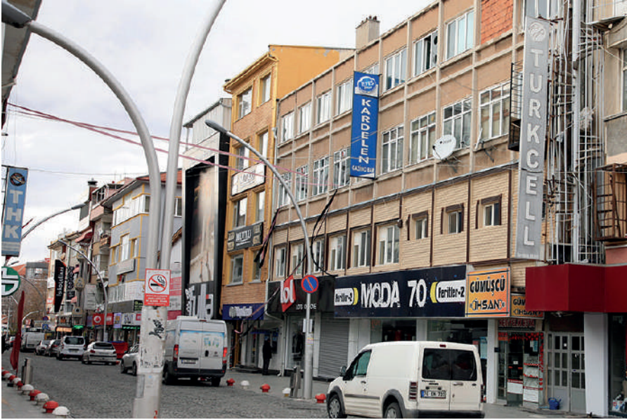
Fotoğraf 32: İsmet Paşa Caddesinde yer alan gazino. Ahmet Özpınar.

Cumhuriyet Parkı civarından Aktekk'e 15 Temmuz ve Demokrasi Meydanına kadar olan bölge Karaman sakinlerinin en yoğun kullandığı mekânlardandır. Tabiri caizse bu bölge şehrin kalbinin attığı yerdir. Gün içinde bu bölgede, şehrin başka yerlerinde olmadığı kadar fazla hareketlilik olur. Kentliler gündelik işlerinin çoğunu burada halleder. Böylesine yoğun kullanılan bir bölgede yer alan alkollü mekânlar şehir sakinlerini rahatsız etmektedir.