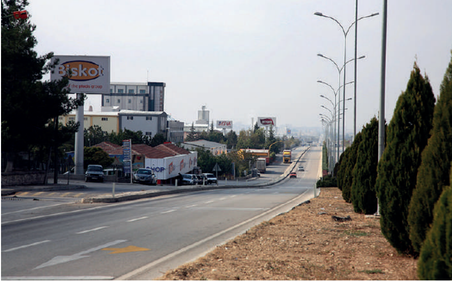
Fotoğraf 20: Organize sanayi ve bisküvi fabrikaları. Abmet Özpmar.

Bisküvi fabrikalarının kurulması ile birlikte Karaman sakinlerinin çalışabileceği yerler artmıştır. İşsizlik oranı ciddi biçimde düşmüştür. Öyle ki bazı dönemlerde Karaman'da işsizlik oranı yüzde sıfır oranındadır. Yani fabrikaların kurulması ile birlikte şehirde işsizlik gibi bir sorun kalmamıştır. Görüşmecilerden K39 bu durumu ilginç bir örnek üzerinden şöyle ifade etmektedir: