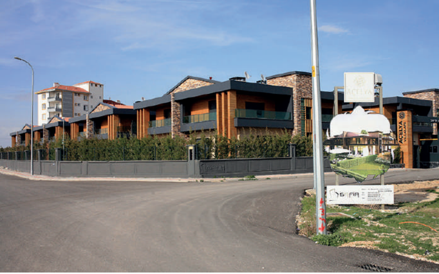
Fotoğraf 21: Şeyh Şamil Mahallesindeki villa tipi konutlar. Ahmet Özpmar.

Genel olarak şehrin belli bölgelerinde varlıklı ailelerin, bazı bölgelerinde ise yoksul ailelerin yoğunlaştığı söylenebilir. Ancak Karaman'daki mahalleleri birbirinden ayıran temel unsur bu ekonomik farklılıklar değildir. Geçmişte ekonomi temelli mekânsal ayrışma daha belirgin olsa da günümüzde yaşanan kentsel dönüşüm gibi süreçler mahallelerdeki zengin-fakir ayrımını belirsiz hale gelmiştir. Dar gelirlilerin yaşadığı mahallelere inşa edilen lüks sitelerin yanı sıra, zenginlerin yaşadığı mahallelerde halen varlık gösteren gecekondular tipi evler keskin bir ayrımın olmadığını gösteren örneklerdir. Yine de gelir düzeyi ile yaşanan mahalle arasında bir ilişki olduğu görmezden gelinemez bir gerçekliktir.