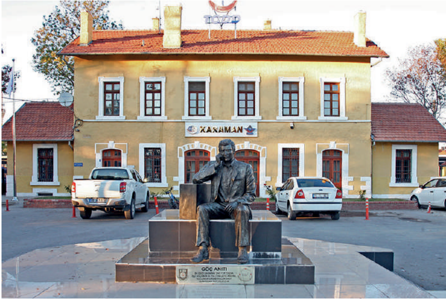
Fotoğraf 11: Karaman tren garı önündeki Göç Anıtı. Ahmet Özpınar.

Anıttaki kişinin kim olduğu meçhuldür. Ancak dirseğini tahta bavuluna yumruğunu yanağına dayamış bir halde düşünen "ilk gurbetçi"yi temsil eden bu anıt, Karaman tarihini bilenlere anlamlı gelmektedir. Görüşmeler esnasında görüşmecilerden pek çoğu Göç Anıtı fotoğrafına ilgi göstermiş ve anıtla ilgili şunları söylemişlerdir: