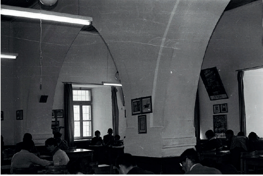
Fotoğraf 7: Hacı Beyler Camisi kütüphane olarak kullanılırken.

Herhangi bir mekânın asıl yapılış amacı dışında kullanılması herkesi rahatsız eden bir durumdur. Ancak K4 bu işlev değişikliği ile ilgili olarak ilginç bir durum tespiti yapmaktadır: “başka yapacak yer de yoktu” . Dönemin şartlarında caminin kütüphane olarak kullanılmasını meşru bir zemine oturtan bu ifadenin devamında K4 camiye tuvalet yapıldığını söylemiştir. Bu durum şehir hafızasının derinlerinde yatan rahatsızlığı artırmış olmalı ki, sonuçta mekânın asıl yapılış gayesine döndürülmesine sebep olmuştur. Ancak caminin kütüphane olarak kullanılması uzun süre boyunca Karaman sakinlerinin hafızasından silinmemiştir. Bugün bile halk arasında camiye Hacı Beyler denmesinin yanında kütüphane cami de denmektedir. Görüşmecilerden K2 fotoğraf albümüne bakarken ilk etapta caminin adını hatırlayamamıştır: