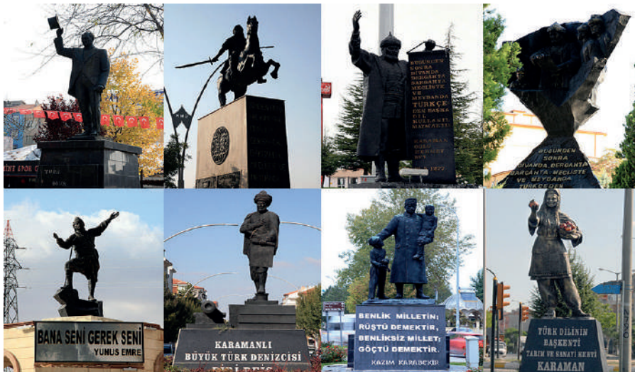
Fotoğraf 9: Karaman'da yer alan heykellerden bir kolaj.

Unutturmama işlevinin bir başka yönü hafızanın canlı tutulmasıdır. Kolektif hafızanın canlı tutulması, bu hafızanın yeni nesillere aktarılması ile mümkündür. Kültür aktarımı sözlü olarak gerçekleştirilebileceği gibi görsel olarak da gerçekleştirilebilir. Bu açıdan bakıldığında anıtlar ve heykeller, temsil ettikleri değer ve anlamları bilmeyen şehir sakinleri için hafıza oluşturucu bir işlev görürler. Şehir tarihinde iz bırakmış bir olayı bilmeyen şehir sakinleri anıtlar ve heykellerin anlamını merak ederek araştırmaya koyulur. Şehre dair yabancı olduğu meseleleri anıt ve heykeller üzerinden öğrenmeye başlar. Bu noktada anıt ve heykeller toplumsal hafızayı devam ettirici objelere dönüşürler.