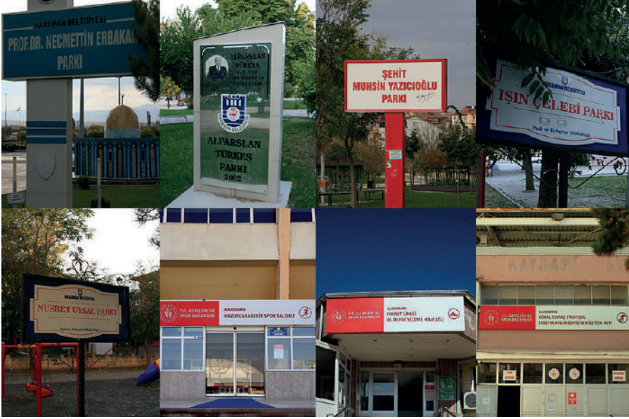
Fotoğraf 13: Siyasi figürlerin isimlerinin yer aldığı tabelalardan bir kolaj.

Şehirdeki muhtelif noktalara siyasi isimlerin verilmesi konusunda bir görüş birliği yoktur. Kimi görüşmeciler siyasilere isimlerinin verilmesine olumlu bakarken kimi görüşmeciler hoş karşılamamaktadır. K9, K32 ve K33 siyasilere isimlerinin verilmesi ile ilgili olarak şunları söylemişlerdir: