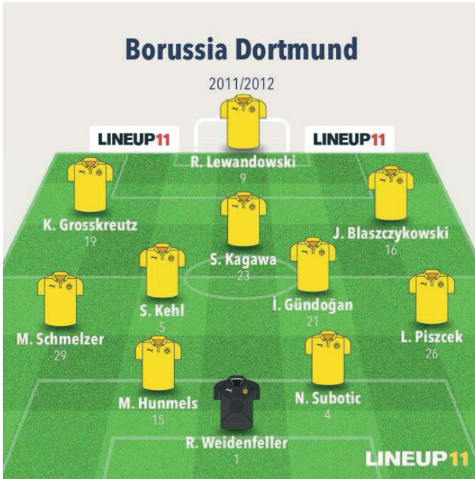
Resim 7. 2011/2012 Bundesliga, Borussia Dortmund-Bayern Münih maçı sistem, diziliş

ve ani pres yapmayı içerir. Bu taktik rakibin oyun kurmasını bozmayı ve hızlı hücum fırsatları yaratmayı amaçlar) yüksek tempo ve direk oyunu, birlikte hareket eden hareketli orta sahası, dinamik ön hattı, defansif organizasyonu ve esnek oyun formasyonlarını takımında uygulatmış ve futbol tarihinin en özel lig şampiyonluklarından iki tanesini üst üste kazanmıştır (2010-2011/2011-2012). Genelde 4-2-3-1 formasyonunda sahaya çıkan Klopp'un öğrencileri taktiksel formasyondaki değişikliklerle rakibe göre 4-4-2 ve 4-3-3 formasyonları ile de sahada yer almıştır (Bergman, 2020). Elinde bulunan kadroyu geliştirmesi ve başarı yakalaması Klopp'u sonraki yıllarında da tanımlayacak özelliklerinden biri olmuştur. Dortmund yıllarında da tarihin en özel kadrolarından birini yaratan Klopp'un kilit oyuncularını, defans hattında sadece kuvvetli özelliği ile değil aynı zamanda oyun kurulumu ile de öne çıkan Hummels, orta sahada kazandığı toplarla atak başlatan ikili Bender ve İlkay Gündoğan, önlerinde yaratıcı oyuncular Götze ve Kagawa, kanat oyununda içe kat eden Reus ve en uçta fiziksel kapasitesi ile tekniğini de öne çıkaran Lewandowski olmuştur (Honigstein, 2017; Williams, 2013). Dortmund'da Şampiyonlar Ligi'ni finalde kaybeden Klopp son sezonunda yaşadığı düşüşün ardından Dortmund'dan ayrıldı ve hikayesinin geri kalanını en özel şekilde yazmak için Liverpool'un yolunu tuttu.