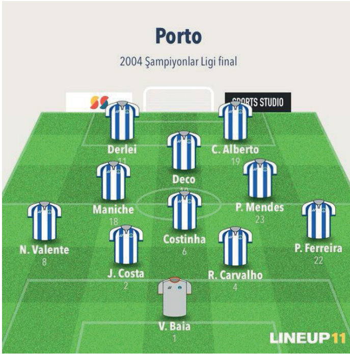
Resim 3. Şampiyonlar Ligi 2004, Porto-Monaco maçı sistem, diziliş