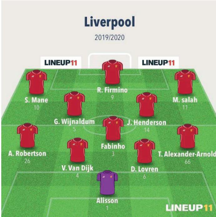
Resim 8. 2019/2020 sezonu Premier Lig, Liverpool-Manchester City maçı sistem, diziliş