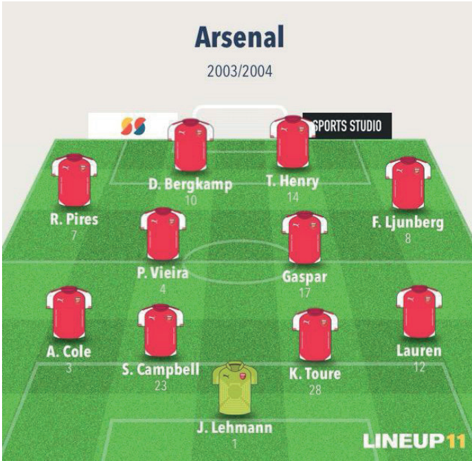
Resim 4. 2003/2004 İngiltere Premier Lig, Arsenal-Manchester United maçı sistem, diziliş

Özellikle oyuncuların zayıflıkları üzerine özel driller yapmadığını fark eden Wenger bu tarz bireysel drill antrenmanlarını programa ekledi. Öncesinde dayanıklılık üzerine inşa edilen takımlar oyununun bütünü gerekliliklerini görmüş oldu. O dönem için devrim sayılabilecek sahanın uzunluğunu ve antrenmanın yoğunluğunu değiştirerek yaptığı antrenmanlar değişimin başlangıcıydı. Temel olarak bu değişikliklerle başlayan Wenger, futbol tarihine damgasını 2003-2004 sezonunda İncible (yenilmezler) Arsenal kadrosu ile vurmuştur. Klasik İngiliz futbolunun haricinde hızlı paslarla yer değiştirerek, kontra atak futboluna önem verdi. Özellikle de “Invincibles” o dönem savunma açısından da olağanüstüydü ve sadece 26 gol yemişti. Sol Campbell ve Kolo Toure defansta atletizmleri ve zekâ ile mükemmel bir karışımını oluştururken, Jens Lehmann kalede uluslararası bir klas sergiliyor ve Ashley Cole ile Lauren dinamik bir bek ikilisi oluşturuyordu. Ancak önemli olan sadece futbolcu kalitesi değil, aynı zamanda oyun kurma şekilleriydi. Gilberto Silva ve Vieira savunmayı korumakla görevlendirilmişti ve Cole ile Lauren hücum etme ve konusunda beklerden o dönem alınabilecek en iyisiydi. Pires ve Ljungberg sahada çalışkanlıkları ve topu takımda tutma karakterleri ile değişilmez parçalar oldular. Begkamp’ın olağanüstü tekniği ile Henry’nin hücumda bitiriciliği birleşince ortaya futbolun en muazzam hikâyelerinden biri ortaya çıkmıştı (Singh, 2023; Platt, 2023).