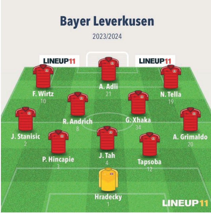
Resim 11. 2023/2024 Bundesliga, Bayer Leverkusen-Bayern Mönih maçı sistem, diziliş