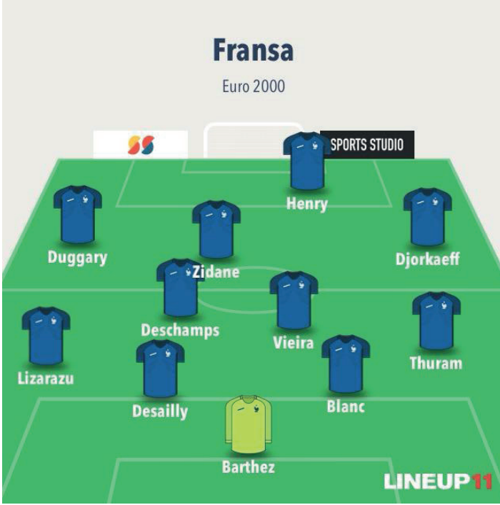
Resim 2. Euro 2000, Fransa-İtalya final maçı sistem, diziliş (Maç kadroları Lineup 11 uygulaması kullanılarak yapılmıştır)