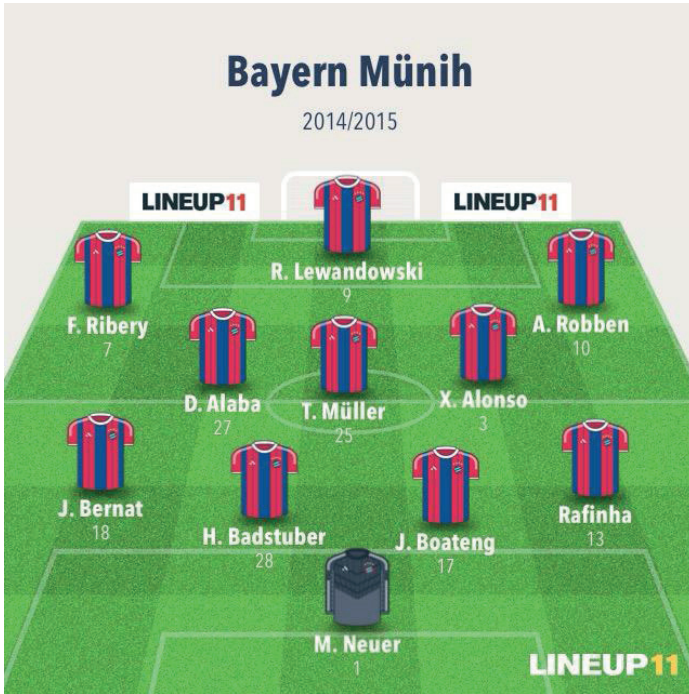
Resim 6. 2014/2015 Bundesliga, Bayern Münih-Borussia Dortmund maçı sistem, diziliş

tamamen vazgeçti ve sahte 9 taktiğini ortaya çıkardı. Bayern ise son sezonlarda savunmayı iki derin orta saha oyuncusunun koruduğu, hücum oyununun kanatlardan geliştirildiği ve gol atan bir santraforun etrafında şekillendiği 4-2-3-1 dizilişini tercih etti. Guardiola Munich'te 3 harika sezonun geçirdi ancak o sezonlarda bir Şampiyonlar Ligi kazanamamış olması onu başka maceranın içine attı. Guardiola, Bayern'in ardından çok istediği kupa için Manchester City'nin yolunu tuttu.