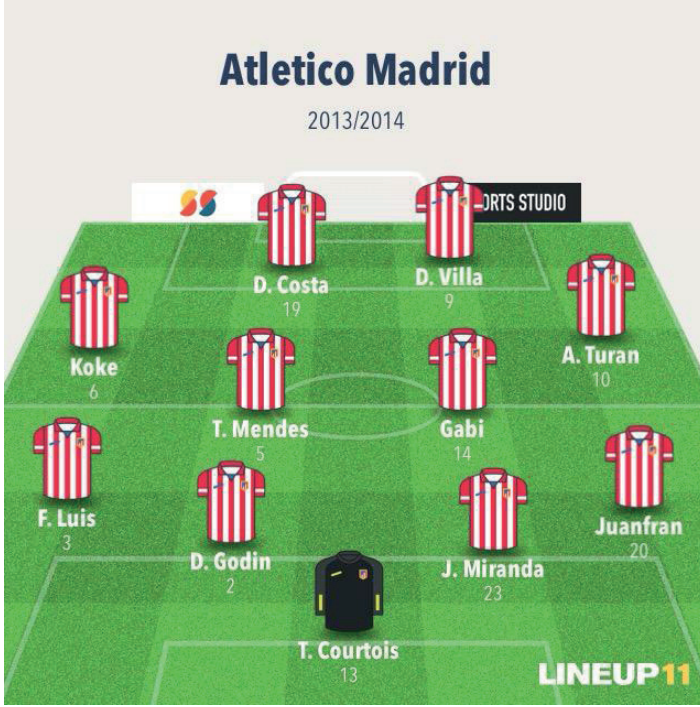
Resim 9. 2013/2014 La Liga, Atletico Madrid- Barcelona maçı sistem, diziliş