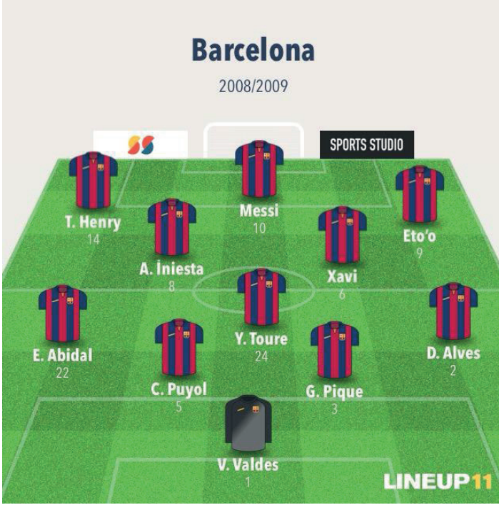
Resim 5. 2008/2009 İspanya La Liga, Barcelona-Real Madrid maçı sistem, diziliş