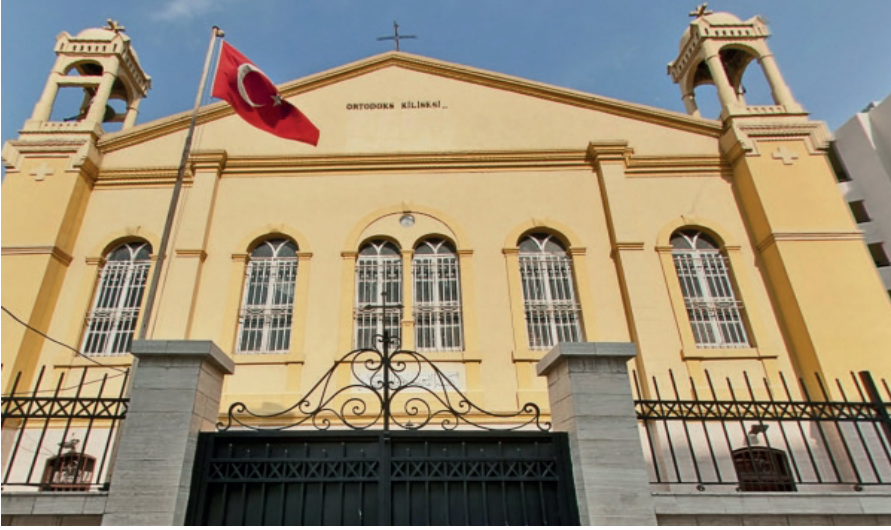
Resim 9. Aziz Nikola Ortodoks Kilisesi

(Restorasyon aşaması devam etmektedir)