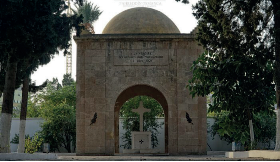
Resim 5. Fransız Askeri Mezarlığı