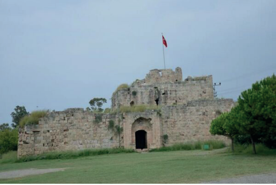
Resim 2. Alexandretta Antik Kenti (İskenderun/Hatay).