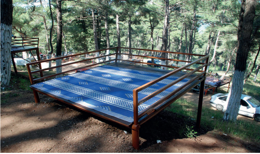
Resim 11. Soğukoluk Güzelyayla'dan Bir Görünüm (Soğukoluk Güzelyayla)