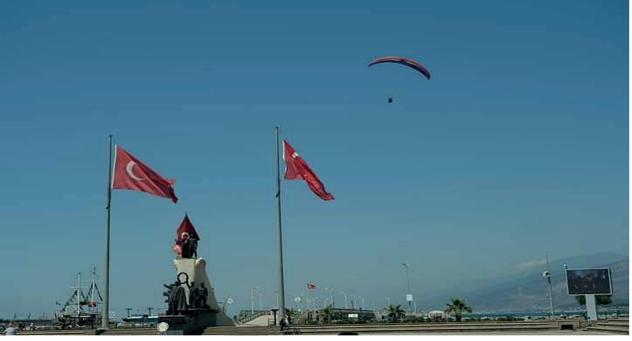
Resim 10. İskenderun Yamaç Paraşütü (İskenderun).