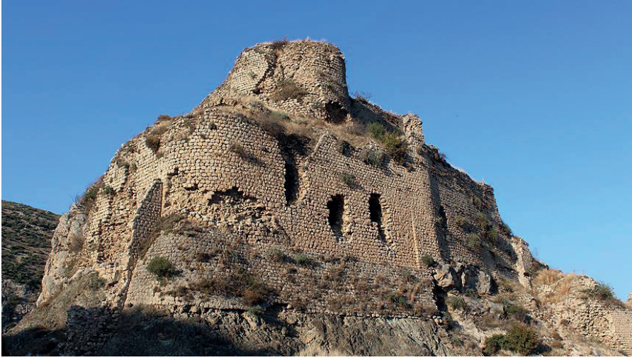
Resim 3. Bakras Kalesi (Bakras Köyü)