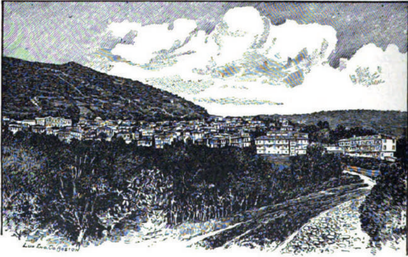
PART OF THE TOWN OF BARDEZAG.

EK 5 Pierce, "Who Are The Armenians?", s. 59.