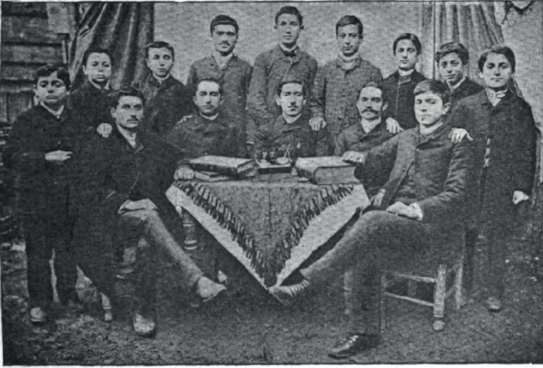
CLASS IN THE BARDEZAG HIGH SCHOOL.

EK 7 Pierce, “Who Are The Armenians?” , s. 61.