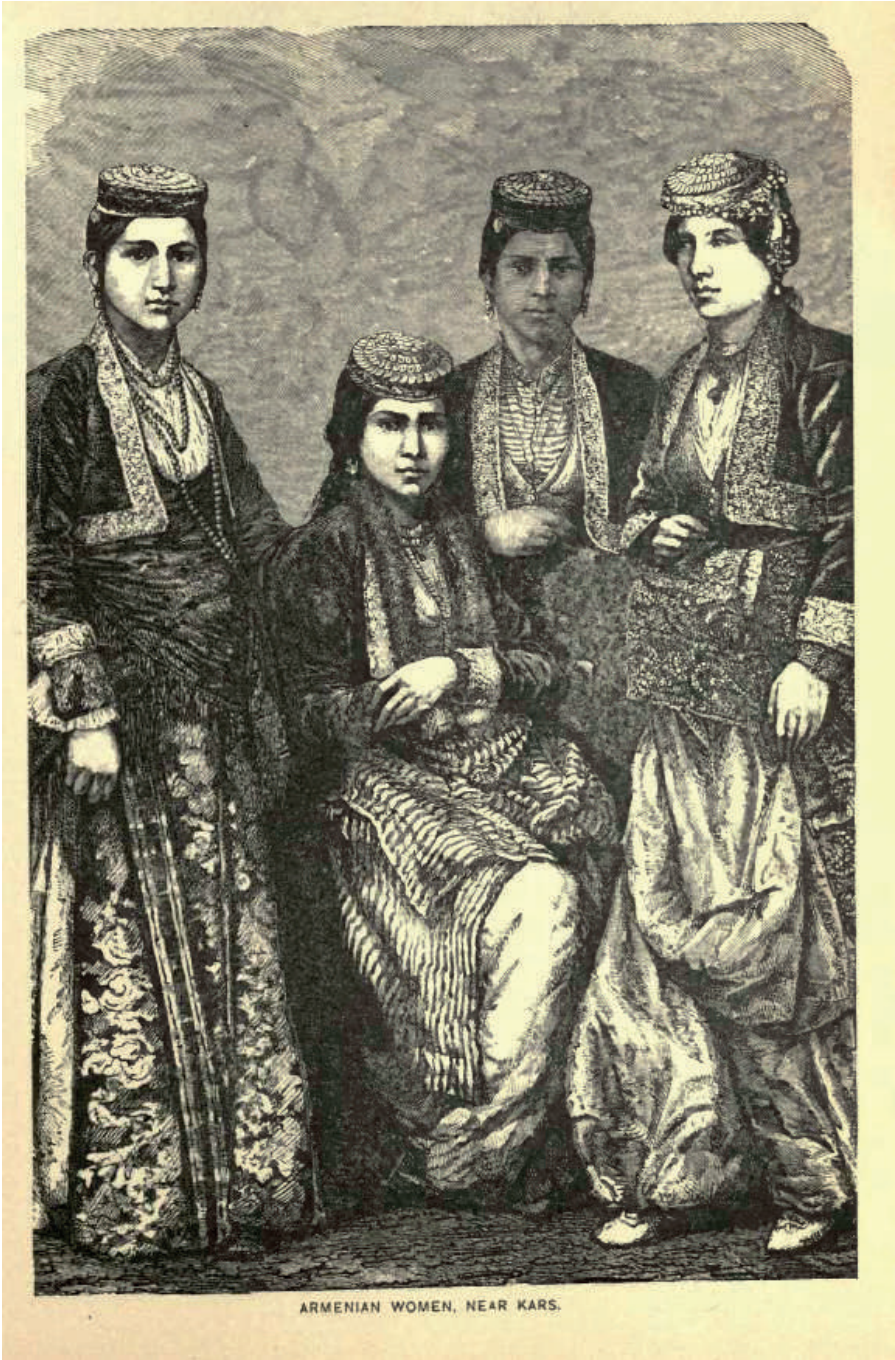
EK 4 "The Armenians", Mission Stories of Many Lands , s. 99.