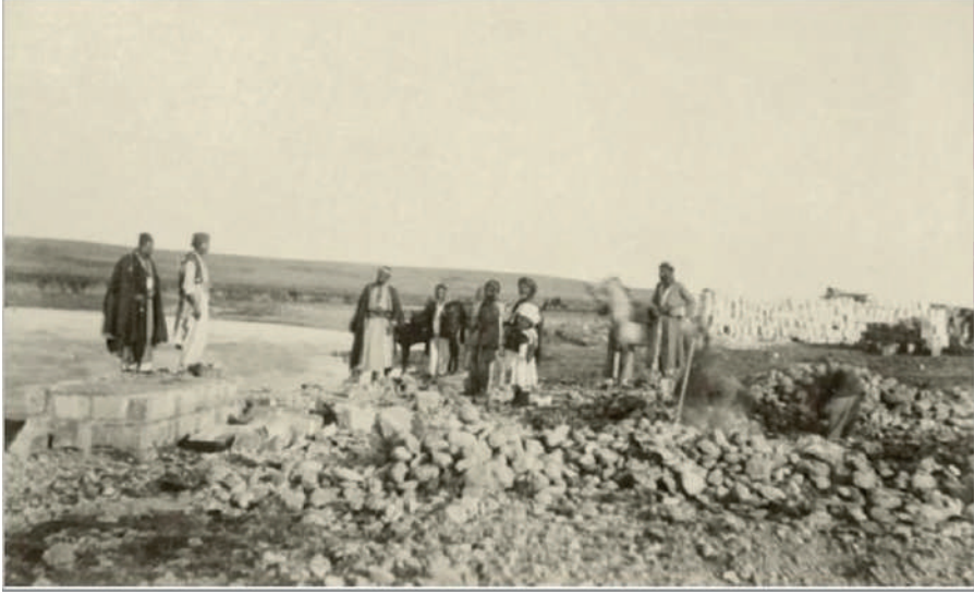
Ek 9: Sacur Köprüsü