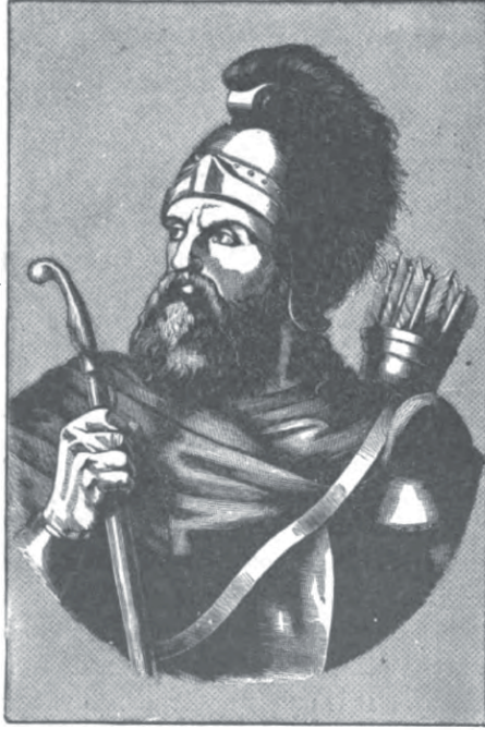
HAIG, THE FOUNDER OF THE ARMENIAN RACE.

EK 5 Pierce, "Who Are The Armenians?", s. 59.