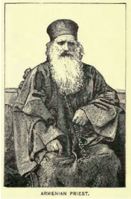
EK 1 "The Armenians", Mission Stories of Many Lands , s. 97.