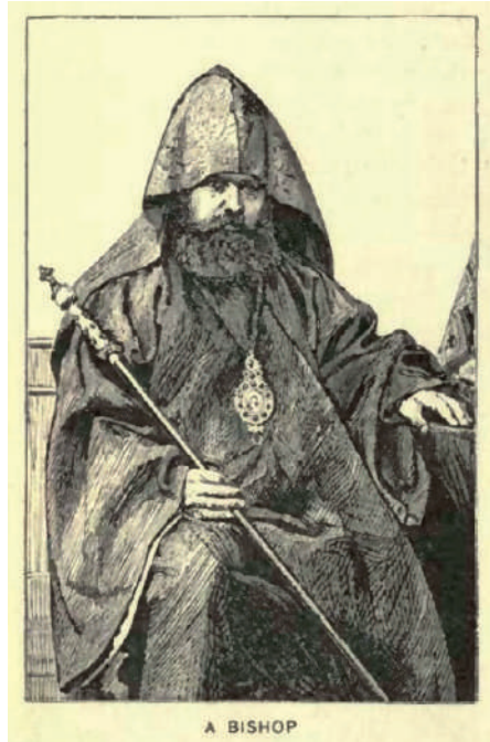
EK 2 "The Armenians", Mission Stories of Many Lands , s. 98.