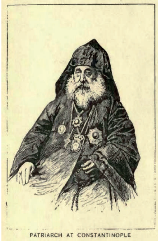
EK 3 “ The Armenians ”, Mission Stories of Many Lands , s. 100.