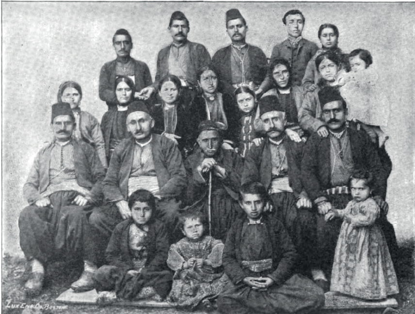
AN ARMENIAN FAMILY.

EK 7 Pierce, “Who Are The Armenians?” , s. 61.