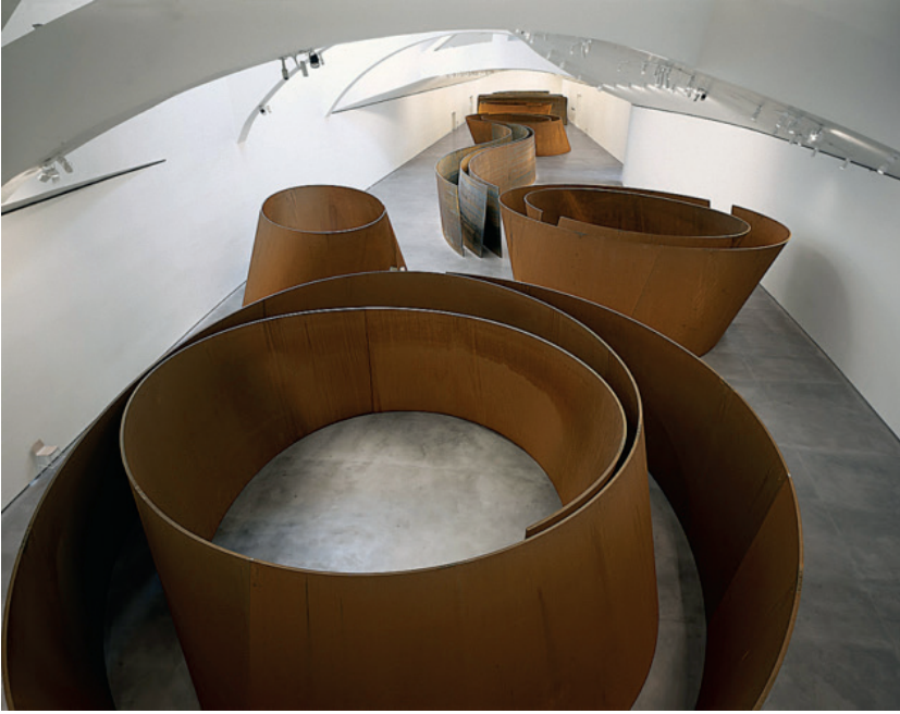
Görsel 2: Richard Serra, The Matter of Time – Guggenheim Museum Bilbao(Url 3)

Güncel(Kavramsal) sanat anlayışında temel düşünce sanat olarak estetik beğeniye bakılmaksızın yalnızca düşünce açısından değerlendirilerek kullanılan her türlü malzeme bir sanat eseri olarak değerlendirilmektedir. Sanatçının aklına bir fikrin gelmesi o andan itibaren bir sanat olarak değerlendirilmektedir. Güncel sanatta eserlerin yalnızca bir alana sıkıştırılması kabul edilemez. Kısacası bu akım sergi alanlarını reddeder. Sanat galeri ve müzelere bağlı değildir. Sanat her an, yer ve zaman içerisinde yapılabilmelidir (Bulut, 2018)