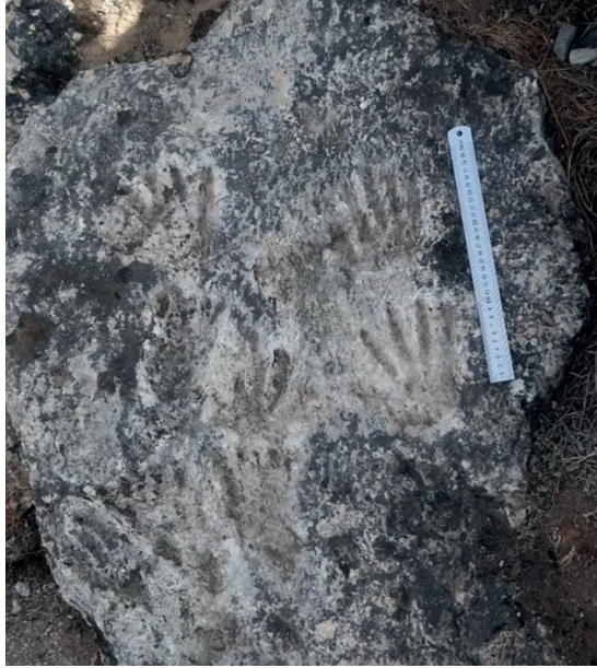
Görsel 1: Dünyanın en eski sanat eseri(Url 2)

Sanat geçmişten itibaren farklı isimlerle anılarak günümüze kadar varlığını korumuştur. Bu isimlerle birlikte tanımında değişimlere uğrayarak anlam ve işlevinde farklılıklarla karşılaşmıştır. Sanata dair sürekli olarak devam eden değişimlere karşın birçok biçim ve üslup anlayışı, yapım yöntemleri, eser ortaya konarken kullanılan temalar günümüzde de halen varlığını sürdürmektedir. Zaman içerisinde insanların yaşam şekli ve karşılaşmış oldukları durumlara yönelik olarak tasvirler maddi veya manevi farklılıklar göstererek sanatın tanımına, anlamına, işlevine ve değerine yansımıştır (Sarı, 2018).