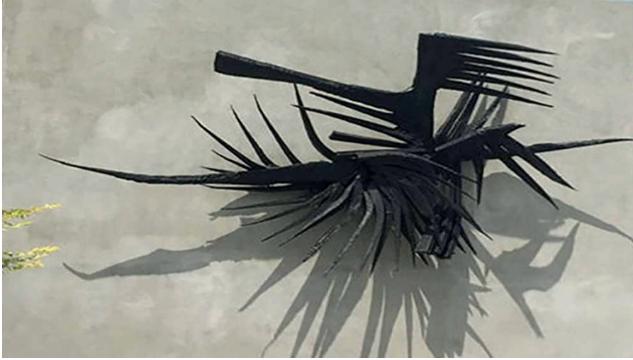
Görsel 3: Kuzgun Acar'ın "Soyut Kuşla" Heykeli(Url 5)

Ülkemizde güncel sanat alanında çalışan isimlerin başında 1960 yılında itibaren Füsun Onur, Kuzgun Acar, resim sanatçılarından Altan Gürman, Bedri Baykam ve Sarkis gibi isimler yer almaktadır (Bulut, 2018).