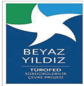
Şekil 6.5. Beyaz Yıldız Logosu

Turizm Otelciler Federasyonu (TUROFED), dünyadaki en önemli problemlerden biri olan çevre kirliliği ve küresel ısınmanın sebep olduğu çevresel sorunları dikkate alan Beyaz Yıldız, 2010'dan itibaren uygulanmaya başlamıştır (TÜROFED 2023). Johnson Diversey, Electrolux ve Grundfos tarafından desteklenen “Beyaz Yıldız” projesi, çevrenin ve kaynakların korunmasına katkı sunmak için işletmelerdeki su, elektrik, enerji, kimyasal ve katı atık miktarının azaltılmasını, çevreye ve doğal kaynaklara verilen zararların minimize edilmesini amaçlamaktadır ( http://www.havuzsauna.com/detay.asp?y=843 , 2023).