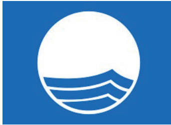
Şekil 6.6. Mavi Bayrak Logosu

Avrupa Topluluğu ülkelerinde 1987'den itibaren uygulanmaya başlanan, Kültür ve Turizm Bakanlığı ve Sağlık Bakanlığı tarafından desteklenen Türkiye Çevre Eğitim Vakfı tarafından yürütülen Blue Flag projesi, Türkiye'de 1993 yılında uygulanmaya başlamıştır. Bu proje; yüzme amacı ile kullanılan göl ve deniz suları için gerekli kalite standartlarını belirleyen mikrobiyolojik parametreleri ve zorunlu hükümleri sağlayan plaj ve marinalarda bulunmaktadır (T.C.Kültür ve Turizm Bakanlığı, Mavi Bayrak Hakkında Genel Bilgiler 2023).