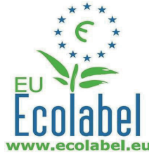
Şekil 6.2. Avrupa Birliği Çevre Etiketi

Eko-etiketler, turizm ürünleri ve üretim yöntemlerinde, hizmetlerdeki ve çevresel süreçteki çevreye zarar veren çalışmaların azaltılmasını temel alan, turizm bölgelerindeki çevre kalitesinin iyileştirilmesini benimseyen piyasa tabanlı bir araç olarak görülmektedir (Kozak ve Nield, 2004: 141). Turizmde eko-etiket, turizm bölgeleri için çevresel kalite etiketleri ve turizm sağlayıcıları için çevresel performans etiketleri olmak üzere iki temel kategoride incelenmiştir. Örneğin, Avrupa'da temiz plajları ele alan Mavi Bayrak, turizm sektöründe çevresel kalite etiketlerine örnek olarak verilirken; daha az enerji tüketimini esas alan ve çevreye en az zararı veren ürünleri içeren Avrupa Birliği Ecolabel turizm sektöründe çevresel performans etiketlerine örnek olarak verilebilir (Buckley, 2001: 20). Dünya'da geliştirilmiş çok sayıda ve farklı özelliklere sahip eko etiketler yer almaktadır. Bu eko etiketlere örnek olarak aşağıda, Avrupa Birliği çevre etiketi (Ecolabel) ve sürdürülebilir turizm sertifikası (Travelife) açıklanmıştır.