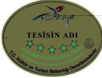
Şekil 6. 4. Yeşil Yıldız Belgesi

verilmesi gibi konuları kapsar (T.C. Kültür ve Turizm Bakanlığı Yatırım ve İşletmeler Genel Müdürlüğü, 2020).