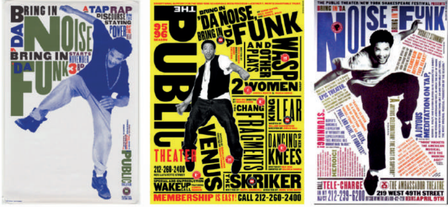
Görsel 8: Paula Scher, New York Halk Tiyatrosu Afişleri, 1995-96.

Scher, Pentagram ortallığında devam eden tasarım sürecinde yarattığı ikonik kimlik tasarımlarına Citibank, CNN, Windows 8, Bausch-Lomb, Tiffany & Co., Grey Group, Bloomberg, New Jersey Performing Arts Center, New 42nd Street Studios, The Metropolitan Opera, ABD Holokost Anıt Müzesi ve Metropolis (Queens Metropolitan Kampüsü) gibi çeşitli müşteriler için kurumsal kimlik, editoryal, tip tasarımı, çevresel grafik tasarımı, ambalaj ve yayın tasarımları gibi işleri örnek olarak verilebilir. Markalar için yarattığı kimlikler ve yüzler Amerikan markalarının çağdaş revizyonuna yönelik bir vaka çalışması haline gelmiştir.