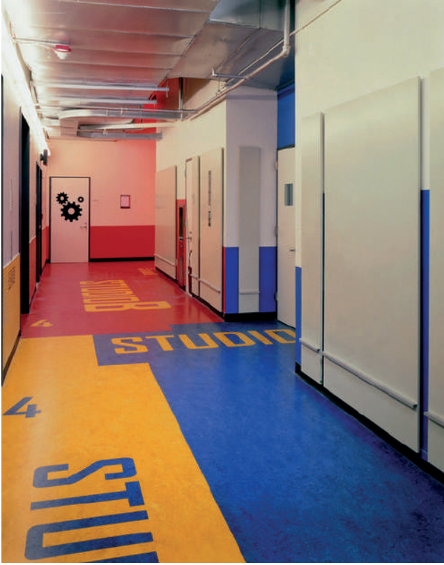
Görsel 10: Paula Scher, New 42nd Street Studios, tip ve çevresel grafik tasarımı. 2000.

ve bakış açısına göre farklılaşabileceği görülebilir. Bu logo'da citi'nin t harfinin üzerindeki kemer çizgisi bir şemsiyeyi simgelemektedir.