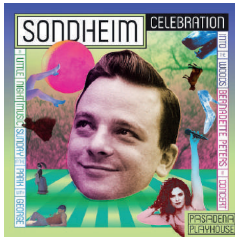
Görsel 14: Pentegram, Paula Scher, Pasadena Playhouse, 2022.

Retronun ilham alabildiği Art Deco, Art Nouveau, Pop Art, Minimalizm, Psychedelic, Bauhaus, geleceğe ve toplumsal dönüşüme odaklanan Rus Konstrüktivizmi gibi tüm sanat ve tasarım akımları güncel ve gelecek teknolojisinin bir entegrasyonunu içerebilecek geçmiş ve gelecek arasında çağdaş atipik sanat ve tasarım formlarını ortaya çıkarabilir. Retro, sanat ve tasarım unsurlarının günümüz grafiksel olanakları ile geçmiş ve geleceğin unsurlularını bir araya getiren fütüristik bir estetiğe sahiptir. Paula Scher'in ortağı olduğu Pentegram'ın güncel afiş tasarımlarında tipografinin retro yansımaları görülmektedir. Tipografi kinetik bir forma dönüşebilecek bir yapı sunarken fütüristik etkiden ve renk paletinden ilham almıştır.