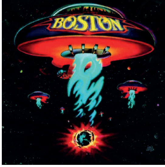
Görsel 3: Paula Scher, Boston Albüm Kapağı Tasarımı, 1976.