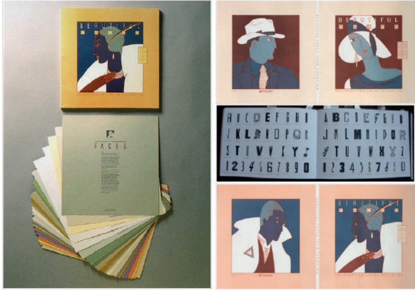
Görsel 7: Paula Scher, Beautiful Faces , 1986.

Scher, 1991 yılında Pentagram'a katılmış ve ortağı olmuştur. Scher'in tipografiye olan eklektik tavrı ile Rus Konstrüktivizmi'nden ve Art Deco'dan esinlenen çalışmalar yapmıştır. Bu çalışmalar tipografinin yeniden tanımlanmasına yüksek ve alçak kültür unsurlarının sembolizmle birleşerek grafik tasarımın dinamik bir ortamını yaratmıştır. Scher'in New York Halk Tiyatrosu yaptığı kimlik ve grafik çalışmaları 1990'ların tipografisine yeni bir vizyon getirmiştir. Alışılmışın dışında tasarladığı metin ağırlıklı posterleri, yoğun miktarda bilgiyi dinamik ve etkileyici bir şekilde sunmaktadır. Afiş çalışmaları modernizm'in düzenliliğini reddeden 1980'ler ve 1990'ların yeni dalga grafik tasarımcılarıyla olan ilişkisini nitelemektedir. Kamu (Public) kelimesine vurgu yapan New York Halk Tiyatrosu kimliği kurumun bütçe ve erişilebilirlik durumunun konumlandırılmasının önemli grafiksel sembolizmidir.