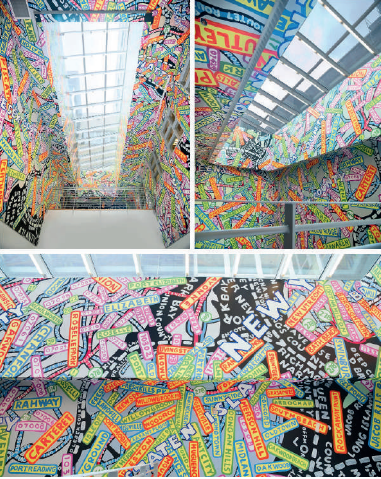
Görsel 11: Paula Scher; Queens Metropolitan Kampüsü, Çevresel Tasarım. 2010.

Scher'in çevresel grafik stildeki tipografik inceliği Queens ve New York metropol alanının benzersiz bir yönlendirmesini sunmaktadır. Belirli konumlara ve topografik özelliklere atıfta bulunarak konum fikirlerini ve dünyayı göreme biçimlerinde yeni bir sayfa açmaktadır. Buradaki tasarım üslubu Scher'in harita çizimlerindeki etkinin bir pastışı gibidir. Ayrıca, New York Halk Tiyatrosu Afişlerindeki modernizmin kesinliğine karşı olan postmodern retro etkinin de izlerine rastlanmaktadır.