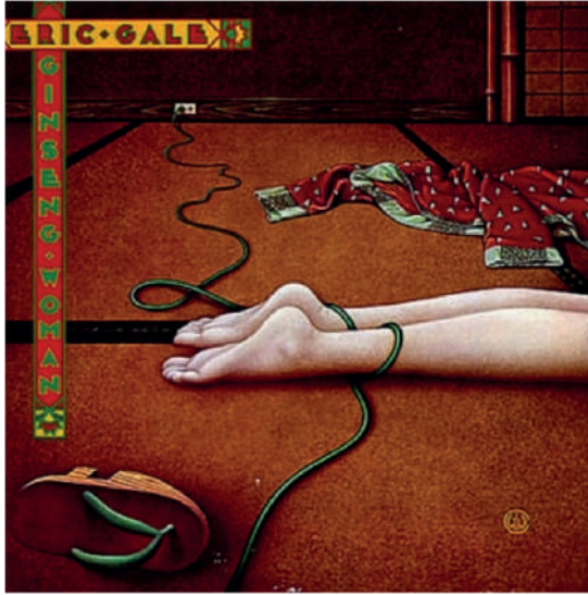
Görsel 2: Paula Scher, Eric Gale albüm kapağı tasarımı, 1976.