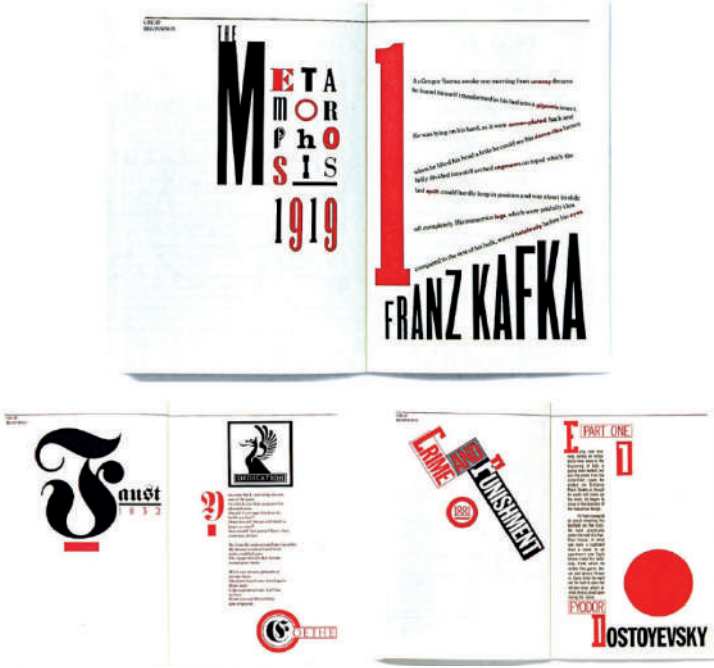
Görsel 5: Koppel ve Scher stüdyo, Büyük Başlangıçlar kitapçığundan kesitler, 1984.

kol saatleri, Bruce Landvall'ın Manhattan Plak Şirketi için Mondrian'dan esinlenen kurumsal kimlik ve Beautiful Faces gibi promosyon ürünleri yer almaktadır. Bu çalışmalar, Scher'in gerçek sanatsal tarzının dışında da olsa müşteri yöneliminde başarılı sonuçlar elde etmiştir.