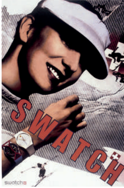
Görsel 6: Paula Scher, Swatch Watch Poster, 1985.

Scher'in "Beautiful Faces" çalışması 1986 yılında insanların kullanabilmeleri için Viktorya dönemi, art nouveau, art deco, stremline vb. birçok yazı karakterinin bir araya getirilerek Champion Papers'ın Carnival kâğıt serisi için bir promosyon olarak yayınlanmıştır. Eksantrik ve deokratif yazı tipinin eklektik bir koleksiyonunun 22 tam fontunu sunan bu eser Champion'nun tarihte en çok talep gören ürünü haline gelmiştir. 40.000 grafik tasarımcıya dağıtılan bu eser tasarım camiası için ücretsiz çoğaltılabilir ve 1920'ler ve 1930'ların eksantrik bir yazı portföyüne erişimi sağlamıştır. Bu da zamanın tasarım stiline üzerine büyük bir etki yaratmıştır.