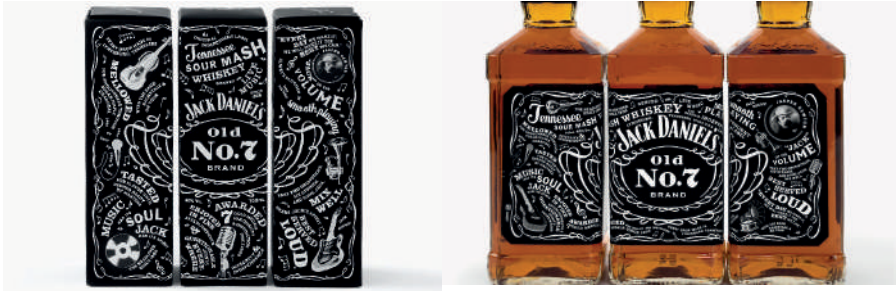
Görsel 13: Pentagram, Paula Scher, Jack Daniels Ambalaj Tasarımı, 2021.