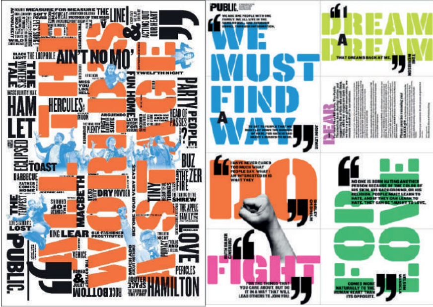
Görsel 12: Paula Scher, Halk Tiyatrosu 2020.

Retro grafik tasarım geçmişin unsurlarını fütüristik unsurlarla da birleştirerek nostalji ve yeniliğin eşsiz bir karışımını yansıtabilme deneyimine sahiptir. Bu grafik tasarım örneklerini bugün birçok mimari projede, çevresel grafik tasarım örneklerinde, moda da ve eşya da görebilmekteyiz. Marka, kurum ve kimlik gibi unsurların iletişim kurma ve tanınma ihtiyaçlarının çözümlenmesi ve sonuçlandırmasına hizmet eden grafik tasarım, günümüz ürün ve hizmetlerinin etkinliğinin artmasındaki en önemli faktörlerden biri de retro-pazarlamadır. Bu kavram son yıllarda popülerleşen uluslararası bir olgudur. Günümüz manşetleri: “Retro-Revival”, “Vintage-Revival”, “Retro-Boom” gibi retro fenomenlerinin önemi vurgulamaktadır (Fort-Rioche ve Ackermann, 2013).