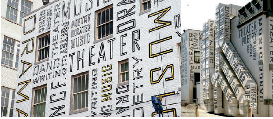
Görsel 1: Paula Scher, New Jersey Performing Arts Center, 2001.

Her tasarımcı gibi Scher de kendi tasarlama sürecini geliştirmiştir. Tasarımı ve tasarım yüzeyini doğru hamleler ile istenildiği kadar farklı kombinasyonların yapılabileceği bir oyun alanı olarak görmüştür. Tasarım sürecinde ciddi ve katı düşüncenin aksine ensek ve eğlenceli bir tavrı savunmuştur. Aksi halde yaratıcılığın kısıtlanacağına vurgu yapmıştır.