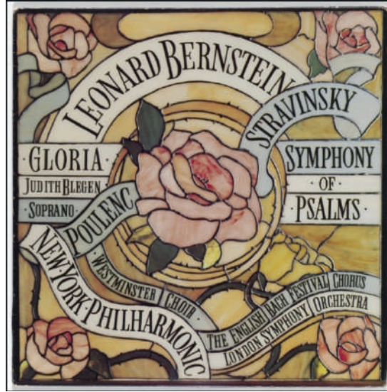
Görsel 4: Paula Scher'in Leonard Bernstein, Poulenc ve Stravinsky'nin eserlerinin performansları için albüm kapağı tasarımı. 1977.

Scher, 1984 yılında ortak olduğu Koppel ve Scher stüdyosunu kurduktan sonra "Büyük Başlangıçlar" kitapçığı dönemsel tipografik yorumlamayla ortaya çıkarmıştır. Burada ünlü romanların ilk iki paragraflarının dönem tarzında yorumlandığı bir tasarım stili izleyiciyi karşılamaktadır. Scher'in Koppel ve Scher'deki diğer çalışmaları arasında kitap kapakları, Swatch