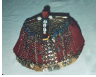
Görsel 6. Fes (Fotoğraf: Yazar)