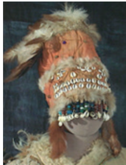
Görsel 4. Altay Şaman Başlığı (Kaynak: Gürcan Yardımcı, 2017: 513)

Başlıkların yapımında vazgeçilmez bir gelenek ise kuş tüylerinin kullanılmasıdır. Kuş tüyü olarak özellikle kartal, puhu kuşu bazen de karatavuk tüyü tercih edilir. Altay manyakları ile giyilen başlıklarda kuşu simgeleyen kuş pörük kırmızı kumaştan yapılır. Teleüt şaman başlıklarında ise yapalak derisi kullanılır. Bu başlığın yapımında kuşun kanatları hatta bazen başı kesilmez. Türk Şaman kıyafetlerinde kadın ve erkek şaman giysileri arasında fark yoktur. Bazen kadın şaman başlıklarında saç örgüsü, boncuklu gerdanlık gibi unsurlar görülebilmektedir. Metal parçalar, çan takılmış atkılar, hayvan kemikleri, boynuzlar ve kuş tüyleri süslemede kullanılan vazgeçilmez unsurlar arasındadır (Mikluho Maklai, 1971:7).