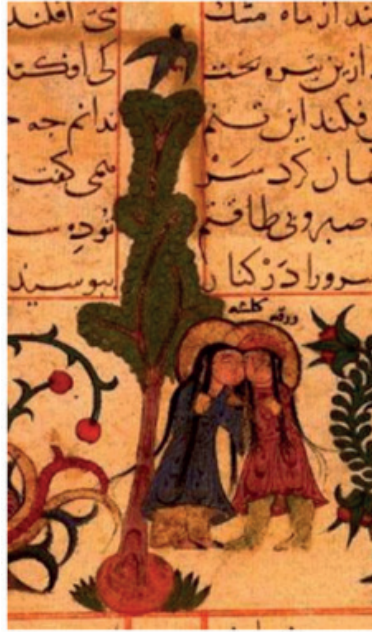
Görsel 1. Varka ve Gülşah (Guliyeva, 2014: 42).

Gizemli soyut dünyanın somutlaştırılarak gerçek dünyaya taşınması şamanın yaratılışındaki kutsiyet ile kıyafetindeki simgelerin bileşmesiyle gerçekleşmektedir. Şaman, özel giysi ve unsurları ile bu dünyaya uyum sağlanmış olur. “Şamanı bir kuş haline getirecek olan tüyler, kanatlar ve gaganın, bir memeli hayvana dönüştürecek kemikler ve boynuzların yani onu toplu olarak hayvan dünyasının hayatına katmak için gerekli her türlü aracın elbisenin üstüne takılması söz konusu olacaktır” (Roux, 2002:64). Yeraltı ve göğe seyahatlerde şamanın kullandığı semboller ve formlar bu bağlamda iletişimi kolaylaştırır.