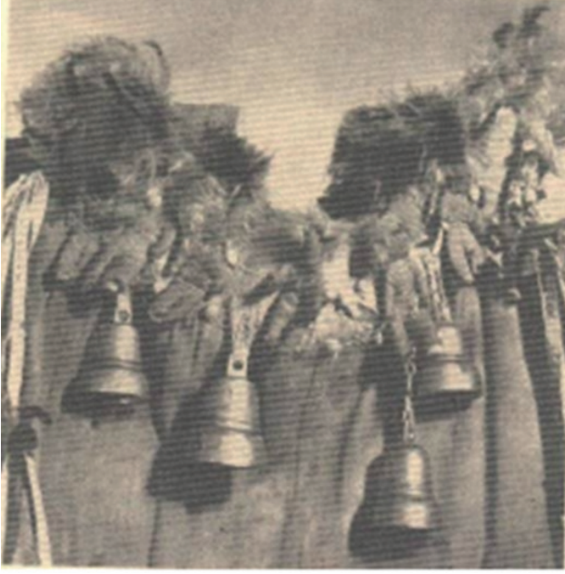
Görsel 2. Şaman Cübbesi Üzerindeki Süslemeler (Oğuz Güner, 2017: 36)

Şaman giysisinde tüm bunların dışında küçük deri torbalar, küçük boncuklarla da süsleme yapılabilmektedir. Ayrıca ata ruhlarını sembolize eden kakım kürkü, ağaçkakan kürkü ayin esnasında şamana eşlik edebilen diğer unsurlardır. Şaman giysisinin yan eklerinden olan Yutpa adını Altay masallarından almış “canlı yutan” anlamına gelen siyah ya da kahverengi kumaştan yapılan büyük sicimdir. Yutpa, şamanı insan yiyen kötü ruhlara karşı korur. Yutpa’nın yerine yeşil kumaştan yapılmış sicime ise Abra adı verilir. Abra baykuş tüyleri ve bir gözü tasvir eden, kırmızı kumaştan yapılmış altısı üst üçü alta olmak üzere saçaklardan ibarettir. Bazı şamanlar için Abra, Ülgenle iletişime geçmek için aracılık görevi görmektedir. Bazı manyaklarda ise Yutpa ya da Abra yoktur; onların yerine kırmızı, beyaz ve sarı renkte özel üç sicim bulunur. Omuz arkasındaki sicimler baykuş tüylerine sahiptir. Bu nedenle de onlara iki omuzun kanatları denir” (Anohin, 2006: 50).