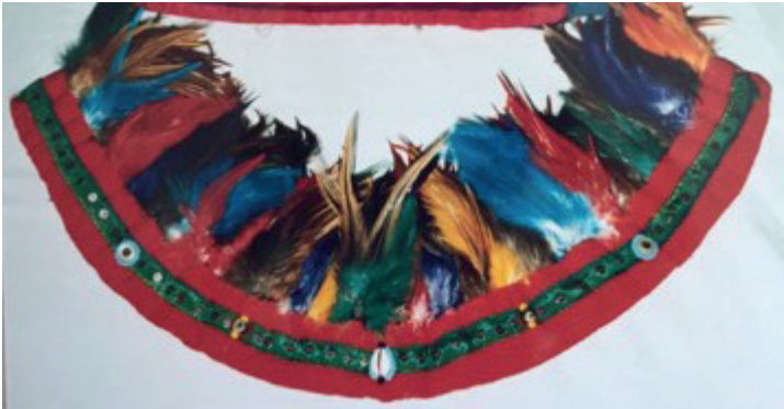
Görsel 8. Gıygı

Dikdörtgen kırmızı pazen kumaşın arasına, boyanmış tavuk tüylerinin yerleştirilmesiyle hazırlanan üzerine nazar değmesin diye iliştirilen boncuk çeşitleri ile süslenen ve duvak üzerine takılan bir aksesuardır. Başlığın en üst katmanında yerini almaktadır. Görsel 8'de gıygı ismi ile bilinen aksesuarın renklendirilmiş kuş tüyleri ile hazırlandığı görsel yer almaktadır.