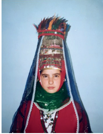
Görsel 5. Belekler köyü gelin başlığı

Geleneklerimizde her yörenin kendine ait düğün törenleri vardır. Konya/İlgın Belekler köyünde de düğünler geleneklere göre yapılır. Evliliğe karar verildikten sonra nişan ve düğün törenleri başlatılır. Yöredeki isimleri; Sıkma (içlik), Kürdü (cepken), Yeşil ve Gudmi (Üçetek), Meydani (Şalvar), Çar (Tülbent), Püsküllü Kuşak ve Kolan olan giysi unsurları ile gelin kız giydirilir. Gelin başı; fes, çeki, gıyığı, enselik ve al ile hazırlanır. Görsel 5'te Konya/İlgın Belekler köyü gelin başlığının süslemeleri tamamlanmış formuyla görseli yer almaktadır.