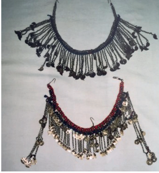
Görsel 9. Enselik

Gelin başı süslemek için duvak üzerine yerleştirilen metal takılardır. Fes etrafına sarılarak uçlarında bulunan kancalar yardımı ile sabitlenerek kullanılır. Görsel 9 iki farklı metal takı görseli içermektedir.