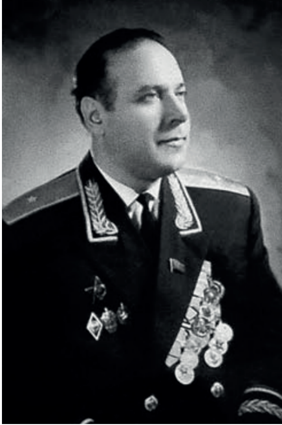
Resim 1: KGB'nin İlk Azərbaycan Başkanı Olan Aliyev

Heydar Aliyev, 1949-1950 yıllarında günümüzde St. Petersburg olarak da bilinen Leningrad'da KGB'nin Kıdemli Kurmay Okulu'ndan mezun olmuştur. 36 Daha sonra 1950 senesinde Azərbaycan SSC Devlet Güvenlik Komitesi'ne daire başkanı olarak atanmıştır. 1957 yılında ise bugün Bakü Devlet Üniversitesi olarak bilinen Azərbaycan Devlet Üniversitesi'nin Tarih Fakültesi'nden mezun olmuştur. 37