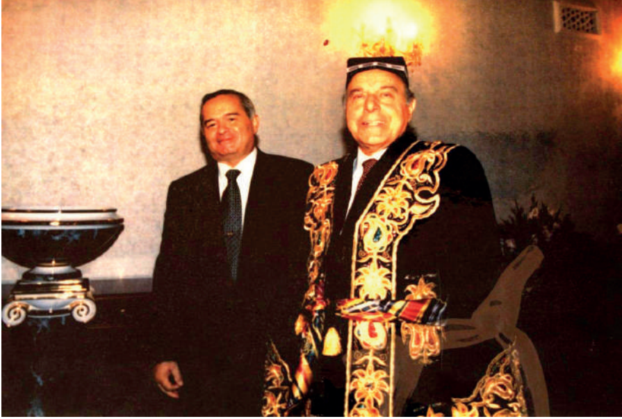
Resim 2: Aliyev, Taşkent'i Ziyareti Sırasında Kerimov ile Birlikte

Kaynak: "ВЕЛИКИЙ ЛИДЕР ГЕЙДАР АЛИЕВ И УЗБЕКИСТАН.", а.ғ.ғ.