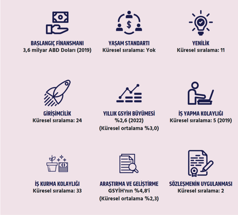
Şekil 2: Güney Kore Ülke Girişimcilik Görüntüsü*

ve giderek daha fazla genç Güney Koreli, girişimcilik faaliyetlerine katılma yollarını araştırmaktadır. Son on yıl içerisinde birçok başarılı Koreli girişimcinin etkileyici girişimler başlatmış olduğu gözlemlenmektedir. Seul şehir yönetimi, 4. Sanayi Devrimi'ne hazırlanmak üzere 10.000 işgücünün yetiştirilmesi ve işsizlikle mücadele amacıyla startuplar yoluyla girişimde bulunmayı planlamaktadır. Bu kapsamda, 4. Sanayi Devrimi'nde öncü bir rol üstlenebilecek şekilde tasarlanmış İnovasyon Akademileri, 2.000 genç Koreliyi eğitmeyi hedeflemektedir. Seul, 2022'de teknoloji girişimlerine ayrılmış alan sayısını iki katına çıkarmıştır. Bunun yanı sıra, Seul şehri, kendi işlerini Seul'de kurmak isteyen genç yabancı girişimcilere hızlı girişli başlangıç vizesi imkânı sunmak üzere Adalet Bakanlığı ile işbirliği gerçekleştirmiştir (Seulz, 2023: A Guide to the Korean Startup Ecosystem).