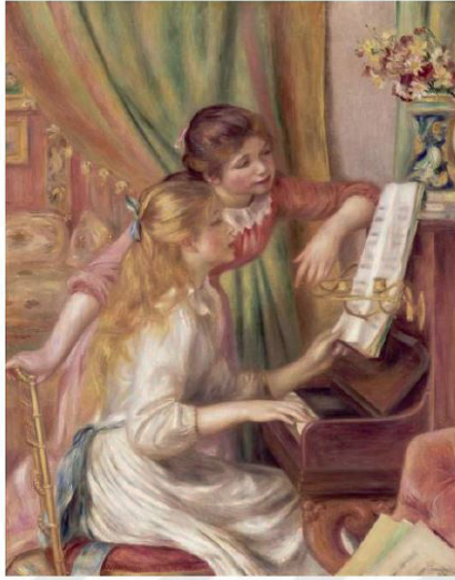
Resim 5. Pierre Auguste Renoir, Piyano Başında Kızlar, 1892 (Ergindir Küçükakaya, 2018, s.45).

Romantik dönemin zirvesinde Wagner'in öncülüğünde müzikte oluşan yenilikçi arayışlar izlenimcilik akımının ve 20. yy. müziğinin ortaya çıkmasına zemin hazırlamıştır. İzlenimci müzik anlayışı, geç romantikte olduğu gibi bir programa sahiptir. Ancak bu program bir konuyu anlatmak değil, esere verilen başlığa göre duygu yaratma eğilimindedir. Bu süreçte egzotik diziler ve yoğun kromatik işleyişe, bir sis perdesi ardından buğulu bir anlatıma sahiptir (İlyasoğlu 2001). Burada betimleyici unsurlar olmamakla birlikte, kişinin duygularında yarattığı izlenimler ön plandadır. Bireyde izlenim yaratma anlayışından ismini almaktadır. Sınırsızca özgür bir şekilde imgesel boşlukta gezinebilmeyi içerir. Bu özgürlüğü İlyasoğlu (2001), "Tıpkı izlenimci ressamların dar stüdyoları bırakıp, tuvallerini kırların ortasına taşıyarak sınırsızlık aramaları gibi" olarak belirtmiştir (s.199).