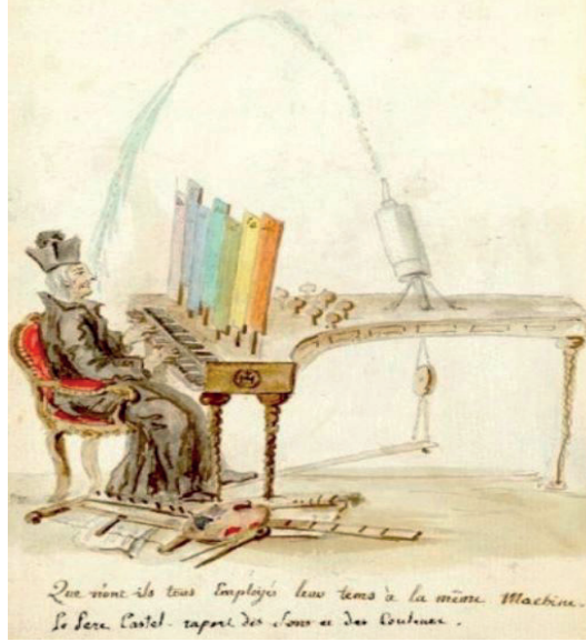
Resim 3. Charles Germain de Saint Aubin, Castel'in renk klavyesiyle bir karikatürü, 1700 (Abacı, 2016, s.35).

Ayrıca Vivaldi'nin resimsel tasviri içeren müziklerinin olduğu bilinmektedir. İlyasoğlu (2001), dört mevsim konçertoları Op. 8 grubunda, mevsimlerin her birinin kendi özelliklerine göre tasvir edilerek resimlendiğini belirtmiştir. Bu anlayış “ses ressamlığı” olarak adlandırılmıştır. Berliöz (1837), “ses ressamlığından bir ifade biçimi olarak yararlanmanın ilk koşulu, onu amaç değil, müziksel ideyi mantıklı ve doğal bir biçimde tamamlayan bir araç olarak görmektir” ifadesiyle açıklamıştır (akt. İpşiroğlu, 1994, s. 103). Ayrıca doğa algısının, sanat ve doğanın aynı olamadığı izlenimi ile yansıtılması, duygulara ilişkin salt somut betimleme içermemesi de önem taşır.