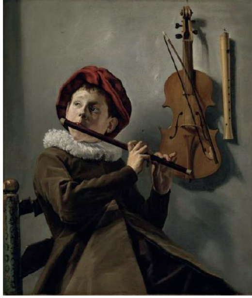
Resim 2. Judith Leyster, Flüt Çalan Çocuk, 1630 (Ergindir Küçükaya, 2018, s. 37).

tekniklerinin 16. yy. ortalarında geliştiğini belirtmiştir. Resimde yer alan öznel kompozisyonlar, müzikte de ortaya çıkmış, duyguların gösterişli anlatımı ve zıtlıkların ön planda olduğu görülmüştür.