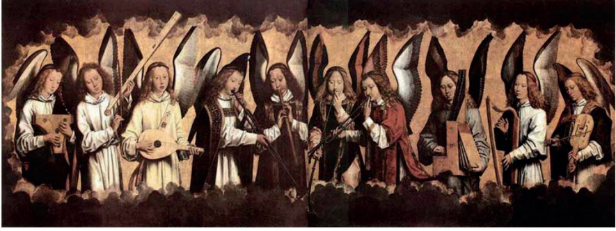
Resim 1. Hans Memling, Melek Müzisyenler; Kraliyet Güzel Sanatlar Müzesi (Ergindir Küçükakaya, 2018, s. 27).

gösterir. Kuzey müziğinin sıkı form anlayışı, yoğun polifonik yapısı, akıcı ritmik dokusu, Kuzeyli ressamın ifadeci yaklaşımı, dramatik anlatımda kullandıkları renkçi tutum ve her ayrıntıya önem vermeleri gibi özellikleri bakımından benzerdir. Benzer bir şekilde, İtalyan müziğinin sade yapısı, homofonik dokusu, arındırılmış ritimleri ve seçkin cümle yapıları, İtalyan resminin kusursuz sadeliği, durağanlığı ve ideal formu bakımından paralellik gösterir”(s.24).