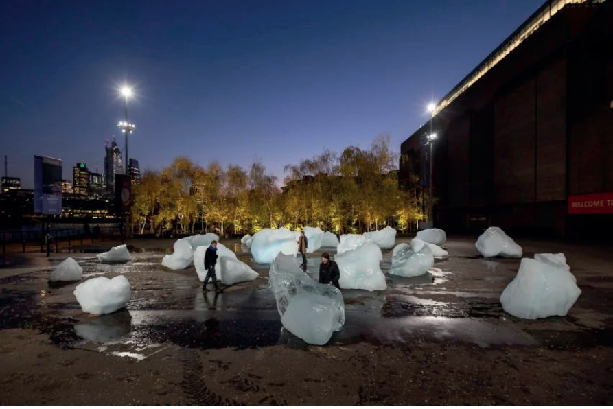
Görsel 1: Olafur Eliasson Grönland buzlarını Londra'da alanlara yerleştirmesi (Url 1)

önemin tekrar eskisi gibi olmasına ve sanatın etkisiyle küresel ısınma ve iklim değişikliğine yönelik eserler ortaya çıkmaya başlamıştır (Arıkan, 2021).