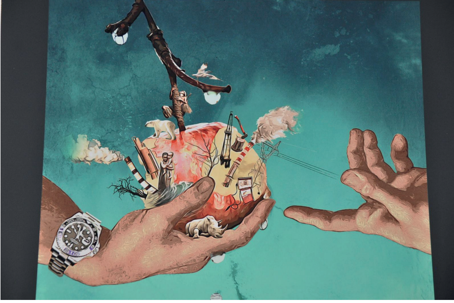
Görsel 5: Yasemin Sayıbaşı Akyüz'ün İklim Krizini anlattığı eseri (Url 5)

Arjantinli sanatçı Leandro Erlich, Miami Lincoln Road sahilinde Art Week boyunca iklim değişikliği sorunu konusundaki farkındalığı artırmak için 66 araba ve kamyonun kum kaplı heykelleriyle bölgeye özgü bir çalışma gerçekleştirmiştir. Sanatçı trafik sıkışıklığının temsili olarak eserini üretmiştir. Ayrıca kuma gömülü olan araçlar, suya batmış izlenimiyle küresel ısınmanın neden olduğu yükselen deniz seviyesini vurgulamıştır (Url 1).