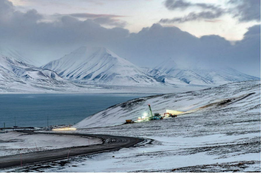
Görsel 6: Murat Germen Küresel İkaz Sergisinden bir fotoğraf (Url 6)

Sanatçı Murat Germen 2022 yılında Kale Tasarım ve Sanat Merkezinde “Küresel İkaz” adlı sergisinde Norveç, Grönland ve Svalbard Adasında çektiği 17 fotoğraf yer almıştır. Sergi ile küresel sorunların temelinde yer alan iklim krizi konusunda toplumlarda farkındalık oluşmasını sağlamak amaçlanmıştır. Sanatçı çalışmalarında insanın doğada yarattığı yıkım, aşırı artan kentleşmenin etkileri, küresel ısınma, su hakları ve iklim değişikliğine önem verdiği görülmektedir.