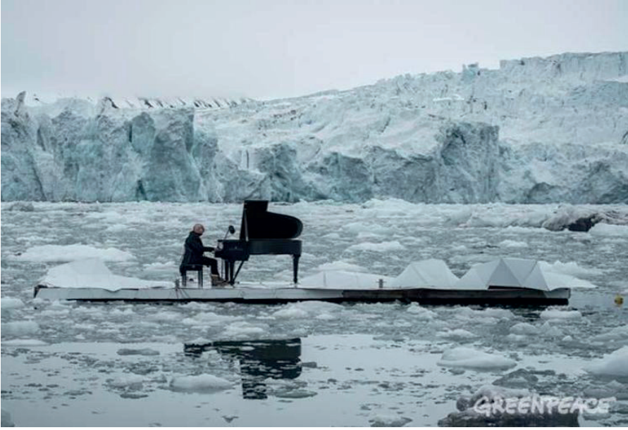
Görsel 2: Piyanist Ludovico Einaudi'nin Kuzey Kutbu konseri (Url 2)

Küresel ısınma sonrasında ortaya çıkan iklim değişiklikleri kutuplarda büyük sıkıntılara yol açmaktadır. Bu sıkıntıların başında buzulların erimesi, deniz seviyesinin yükselmesi ve kutup ayılarının hayatta kalma şansları gün geçtikçe azalması sayılabilir. İşte bu noktada toplumların farkındalığı oluşması için İtalyan piyanist ve besteci Ludovico Einaudi 2016 yılında Kuzey Kutbu'nda daha önce hiç görülmemiş bir piyano konseri ile "Elegy for the Arctic" adlı kendi bestelediği eserini sergilemiştir. Eserinde küresel ısınmanın Kuzey Kutbu'na verdiği zarara dikkat çekmeyi amaçlamıştır (Url 8).