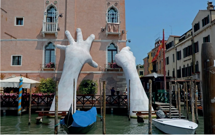
Görsel 7: Lorenzo Quinn'in beykeli (Url 3)

Sanatçı Lorenzo Quinn'in yapmış olduğu heykel, su kanalından çıkan Ca'Sagredo Hotel'ini destekleyen iki eli temsil ediyor. Su kanalında suyla çevrili binanın sanki yıkılmasını engelleyip ayakta tutuyormuş izlenimi veren eller, doğada oluşan iklim krizine ve o alanda yol açtığı sorunların çevreye verdiği zararlara dikkat çekmek istemiştir. Heykel, insanın çevreyi yok etme eylemiyle değil, insanların aynı zamanda bu eyleme dahil olarak sonucu değiştirebileceğinin yansıması olarak gösterilmiştir.