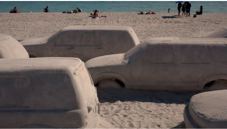
Görsel 4: Leandro Erlich Eseri (Url 1)

Brezilyalı sokak sanatçı Nele Azevedo 2002 yılında başladığı “Minimum Monument” adlı projesi doğrultusunda Sao Paulo, Havana, Paris, Salvador, Floransa, Berlin, Belfast, Santiago, Amsterdam, Tokyo, Birmingham ve Kyoto şehirlerinde yerleştirdiği binlerce küçük buz adam figürlerinin erimesiyle yaşam ve ölümü ön plana çıkarmayı amaçlamıştır. Bu proje birçok kişi tarafından iklim değişikliğine gönderme olarak değerlendirilmiştir.