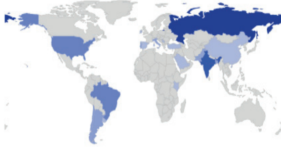
Şekil 1. Mavi Balina Oyunu'nun dünya üzerindeki dağılımları.

Oyunla bağlantılı olan intihar olaylarının dünya çapında gün yüzüne çıkması, 130 ölüm vakasıyla ilişkilendirildiği iddia edilmektedir. 16 kız öğrenciyi intihara ikna ettiğinden dolayı St Petersburg'daki Kresty Hapishanesine yargılanmak üzere atılan bu cani dâhinin ölümcül cazibesine kapılan bir kız hayran kitlesi oluşmuştur ve sayısız aşk mektuplarının geldiği hapishane yetkilileri tarafından bildirilmiştir.