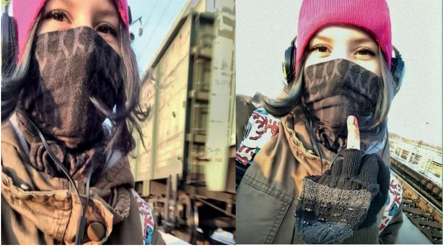
Şekil 4. Dünya Geneline Mavi Balina Vakalarının Medyaya Yansımaları

şalla kapanmış olduğu, orta parmağının ucunda kurumuş kan lekesinin olması ve fotoğrafın altında “Nya Bye” yazısının olması dikkat çekicidir. Tren raylarının oradaki görüntüsünün ertesi günü Rina Palenkova, Primorsky Krai bölgesinde Ussuriysk çehrinde yaklaşmakta olan trenin önüne geçerek 17 yaşında intihar etmiştir.