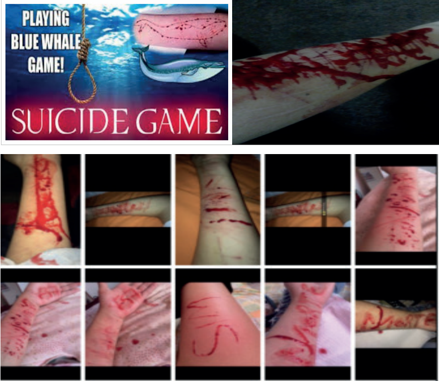
Şekil 3. Görselde verilen komutları yerine getiren katılımcıların vücutlarına verdikleri zararlar

-Bipolar kişilik bozukluğum var ve yaptığım şey zor çocukluğumla bağlantılı. Ağabeyim beni ve annemi dövdü. Sık sık sokakta dövdüler. Eminim hepsinin büyük etkisi olmuştur (Saint-Petersburg.ru, 2016).