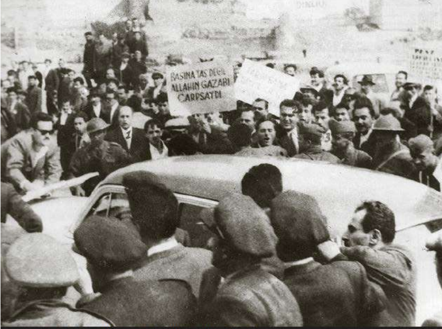
İnönü'nün otomobili Topkapı'da saldırıya uğradı (1959)