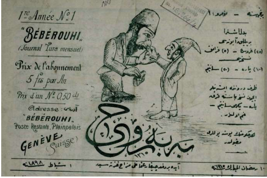
Beberuhi'nin ilk sayısı

merhum tarafından tesis edilmiş olduğundan bu müinasebetle namı mübareklerini yâd ve tebçil eyleriz» 14 .