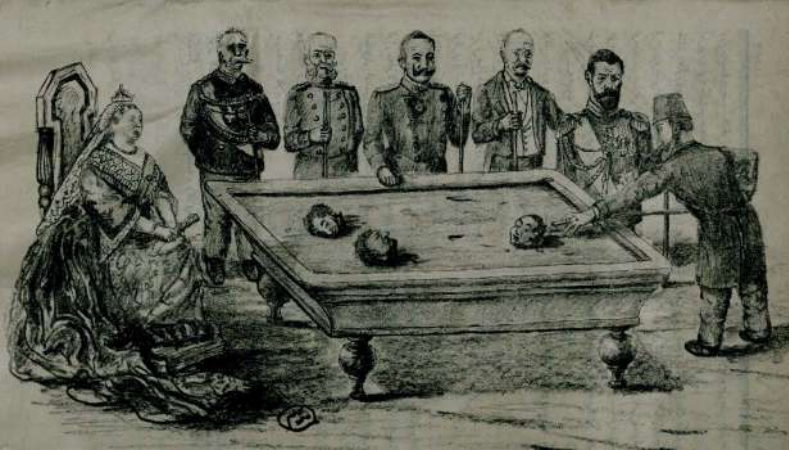
Beberuhi, 7 Şevval 1315 Cuma (1 Nisan 1898), Nu: 3, s.3,8).