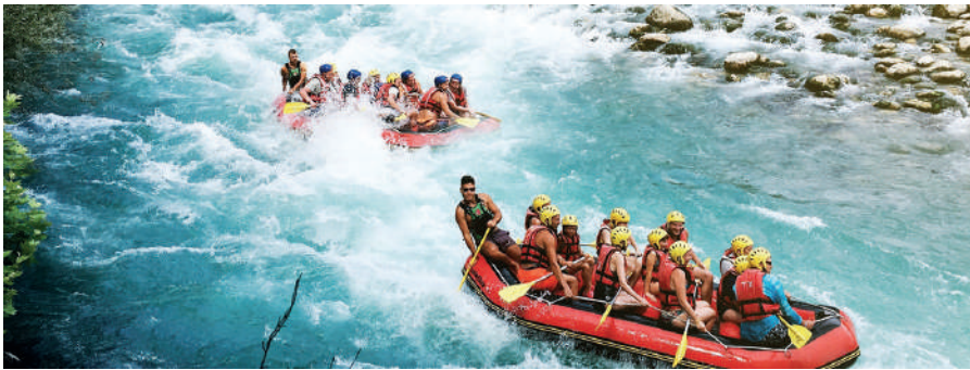
Resim 1. Rafting Örneği

Rafting su sporları dalında uluslararası alanda ve ülkemizde önemli derece ilgi gören bir spor dalıdır (Özkul, 2020). Yapar, Yalçın ve Akıncı (2022)'ya göre eski zamanlarda beri insanlar suyun üzerinde durabilmek için birtakım araçlar geliştirmişlerdir. İkinci dünya savaşı sırasında Amerikalı askerlerin kauçuktan olan şişme botları çıkartma yapmak amaçlı kullandıkları savaş sonrasında ise rekreasyonel amaçlı kullanmaya başlamaları rafting adına bir başlangıç olmuştur (Tamer, 2023). Zamanla rekreatif ve sportif faaliyet haline gelen rafting sporu Sprit, Slalom ve nehir inişi olarak üç disiplinden oluşur (Lekesiz, 2021). Tamer (2023)'e göre çeşitli doğal engeller barındıran akarsu yatağı içinden geçerken bu engellerin aşılması gerekmektedir. Bir başka ifade ile rafting, belirlenen mesafeler doğrultusunda eğimin yüksek ve su hacminin belirli bir seviye geldiği nehir, dere ve akarsuların botlarla belirli standartlar ölçüsünde geçilmesidir (Taşkın, 2019). Uğurlu (2005)'ya göre rafting kano gibi akarsu sporları Türkiye'nin akarsu turizmi için oldukça önemlidir.