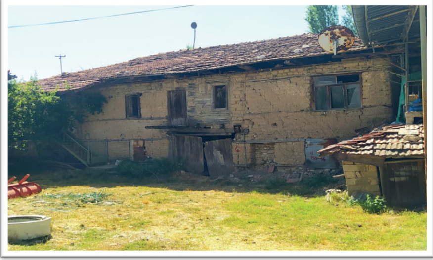
Resim 5. Ev Pansiyonculuğunda Kullanılabilecek Geleneksel Ağlasun Evi (18 Ağustos 2023).

Türkiye’de kırsal turizm denilince ilk olarak yayla etkinlikleri, yürüyüş ya da trekking, mesire alanlarındaki günübirlik yeme içme aktiviteleri akla gelmektedir. Bunlara ilaveten köy ziyaretleri ve köydeki alış veriş içeren günübirlik ziyaretler de anlaşılmaktadır (Akça, 2004; Özdemir Yılmaz ve Kafa Gürol, 2012). Türkiye’de kırsal turizm genellikle, şehirlerin, tarihsel ve kültürel zenginliklere sahip yerleşkelerin çevrelerinde ve/veya antik kentlerin yakınlarındaki köylerde geliştiği görülür. Bu köylerin çoğu hafta sonu yürüyüşlerinde gezi güzergâhı üzerinde oldukları için uğranılan, çevrelerinde piknik yapılan ve yemek yemeğe gidilen yerlerdir. Örneğin; Şirince Köyü, Tire ve Birgi Köyü, Cumalıkızık Köyü ve Uzungöl bu yerlerden bazılarıdır (Avcıkurt ve Köroğlu, 2008: 74). Ağlasun’da da turizm faaliyeti kültür turizmi kapsamında, Sagalassos Antik Kenti’ne ziyaret olarak gerçekleşmektedir (Ceylan ve Gök, 2015). Bu ziyaretler genellikle Antalya’dan Denizli’ye (Pamukkale), Yeşilova Salda Gölü’ne veya lavanta bahçelerine (Isparta/Kuyucak ve/veya Burdur/Lisinia/Akçaköy) ziyaret amaçlı gerçekleştiren turların, belli bir saat aralığına dahil olduğu bir etkinliktir. Bu turlar genellikle hafta sonu gerçekleşen, konaklamanın, yeme içmenin ve alış verişin olmadığı ve yerel halka gelir getirici hiçbir faydası olmayan etkinliklerdir (Ceylan, 2014a).