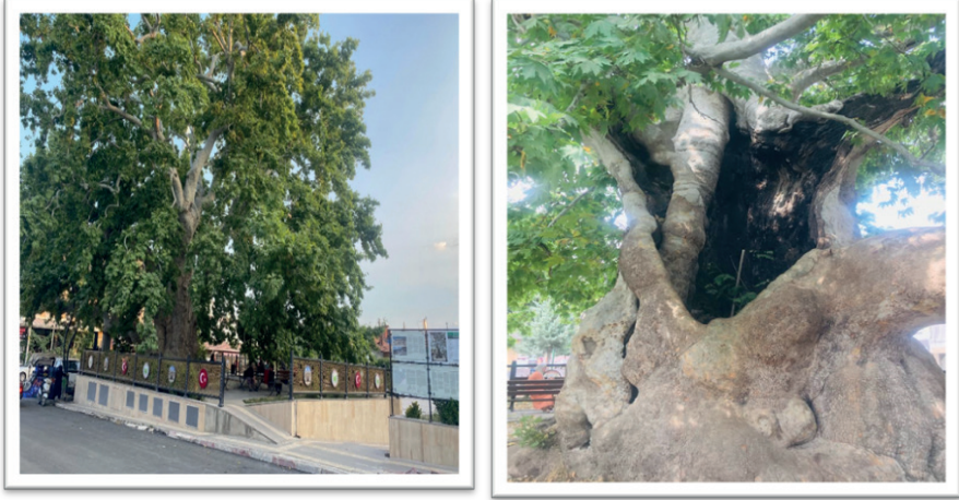
Resim 1. Ağlasun'un Simgesi Ulu Çınar Ağacı (08 Ağustos 2023).

ilçesinin simgesi olan ve 1000 yaşında olduğu tahmin edilen Ulu Çınar ağacı (Resim 1) 3.3 metre çapındadır (baka,ka.gov, 2023). Ulu Çınar ağacının konumu ilçe merkezi ile ilçenin diğer simgesi olan Sagalassos Antik Kenti yol güzergâhındadır (Ceylan ve Gök, 2015).