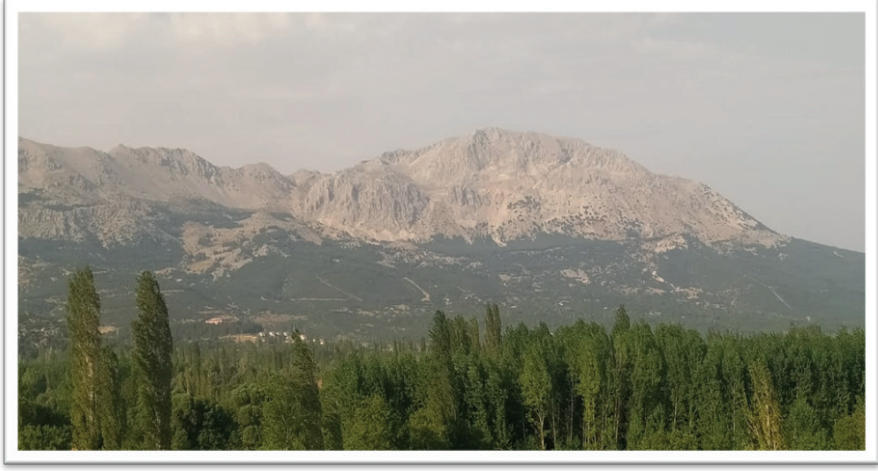
Resim 6. Akdağ (15 Ağustos 2023)

Dağlar: İlçe Akdağ (Resim 6), Peçenek, Dere Boğazı, Yaylacık ve Çatak dağları ile çevrilidir (baka,ka,gov, 2023).