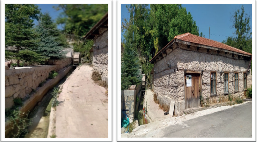
Resim 10. Yeşilbaşköy Tarihi Su Değirmeni (08 Ağustos 2023).

Yeşilbaşköy Tarihi Su Değirmeni, Altındal Su Değirmeni, Çakıroğlu Su Değirmeni, Onur Su Değirmeni gibi değirmenler olup, günümüzde yaklaşık dokuz değirmen kendi kaderine terk edilmiş ve kullanılmamaktadır. Sadece Anıtlar Kurulu tarafından 300 yıl önce kurulduğu ve taşınmaz kültür varlığı olarak tescillenen Akdeniz bölgesinin faal olarak çalışan tek değirmeni Yeşilbaşköy Tarihi Su Değirmenidir (Resim 10). Ayrıca ilçe merkezinde Selçuklu I ve Selçuklu II hamamları mevcuttur. 1200'lü yıllarda yapıldığı tahmin edilen bu hamamlar büyük bir ihtimalle kervansaray hamamı olduğu düşünülmektedir (Altınok, 2016).