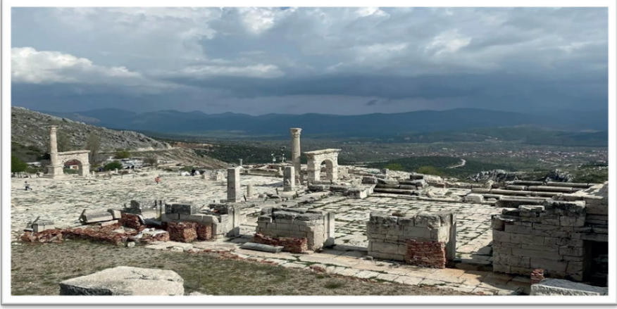
Resim 2. Sagalassos Antik Kenti'nden Ağlasun İlçesi Manzarası (10 Temmuz 2021).

Hellenistik dönemde konumu nedeniyle önem kazanan şehir, zamanının önemli bir ekonomik merkezi haline gelmiştir. Toros Dağları üzerinde kurulan Sagalassos Antik Kenti'nde, yerel seramik endüstrisi, tahıl ve zeytin bölge ekonomisinin en önemli ürünleri olmuştur (Aysal ve Caran, 2018). Sagalassos Antik Kenti, Türkiye'nin iyi korunmuş antik kentlerinden birisidir. Bölgede kültür turizmi kapsamında önemli bir yere sahip olan antik kent, Ağlasun ilçesinin sosyo-kültürel ve ekonomik anlamda gelişmesi için bir araç olarak kullanıla bilinir (Ongun vd., 2017).