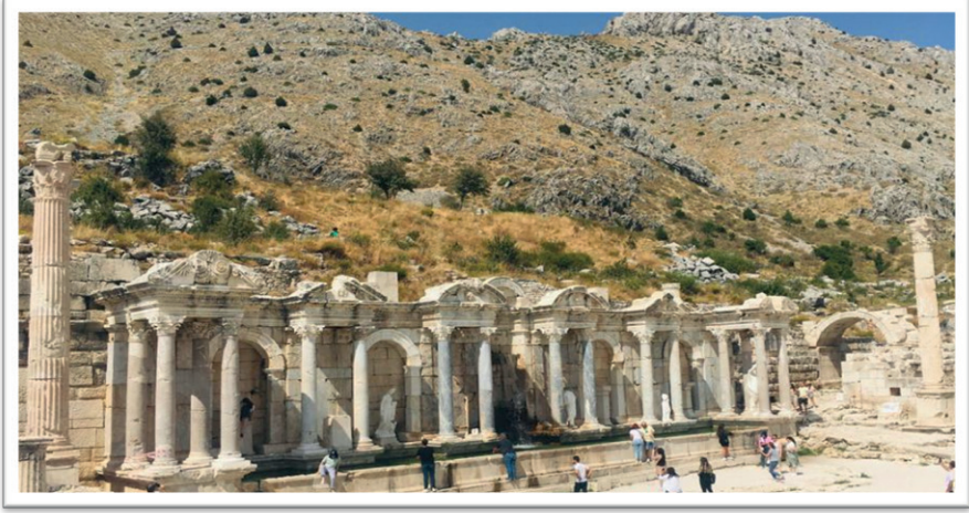
Resim 7. Antoninler Çeşmesi (02 Eylül 2023).

Pınarı, Yaka, Gürleyik, Uzun Kum, Bey Harımı, Kıraç ve Garaç Arası ve Bala ilçedeki diğer su kaynaklarından bazılarıdır. İlçenin bir başka önemli su kaynağı ise, Sagalassos Antik Kenti'nde yer almaktadır. Antik kentin yukarı kent meydanında bulunan Antoninler Çeşmesi (Aşk Çeşmesi) (Resim 7) günümüzde turistler tarafından ilgi çeken bir tarihsel eserdir.