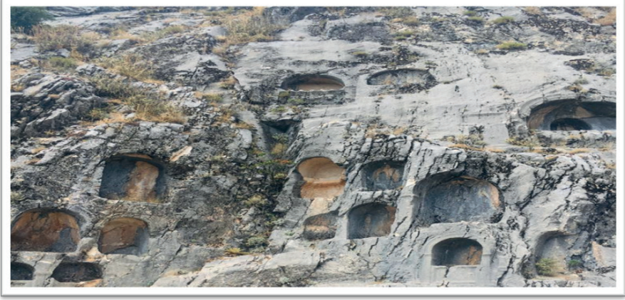
Resim 9. Kaya Mezarları (02.Eylül 2023).

Yeşilbaşköy Tarihi Su Değirmeni, Altındal Su Değirmeni, Çakıroğlu Su Değirmeni, Onur Su Değirmeni gibi değirmenler olup, günümüzde yaklaşık dokuz değirmen kendi kaderine terk edilmiş ve kullanılmamaktadır. Sadece Anıtlar Kurulu tarafından 300 yıl önce kurulduğu ve taşınmaz kültür varlığı olarak tescillenen Akdeniz bölgesinin faal olarak çalışan tek değirmeni Yeşilbaşköy Tarihi Su Değirmenidir (Resim 10). Ayrıca ilçe merkezinde Selçuklu I ve Selçuklu II hamamları mevcuttur. 1200'lü yıllarda yapıldığı tahmin edilen bu hamamlar büyük bir ihtimalle kervansaray hamamı olduğu düşünülmektedir (Altınok, 2016).