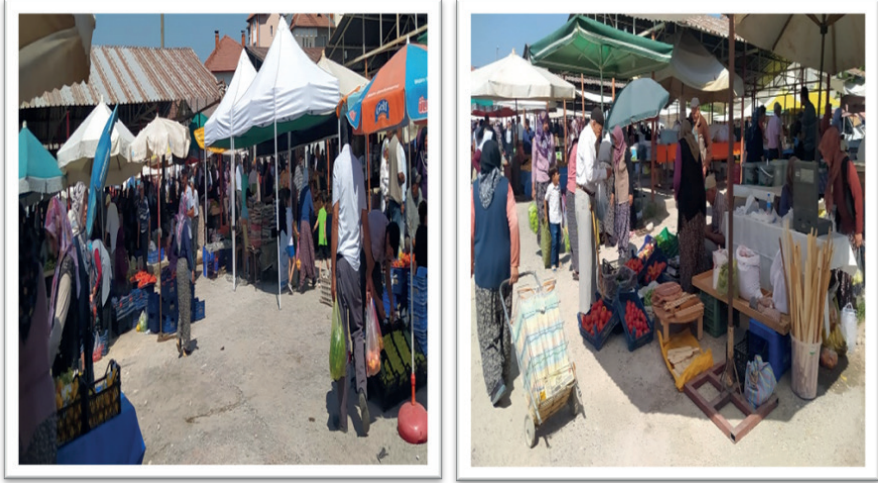
Resim 4. Ağlasun Cuma Pazarı (18 Ağustos 2023).

Turizm potansiyeli açısından oldukça zengin bir çeşitliliğe sahip olan ilçe, hem doğal güzellikler hem de tarihi ve kültürel zenginliklere sahiptir (Ongun ve Gövdere, 2014). Dört tarafı dağlık ve ormanlık alanlarla çevrili olan ilçe, yöresel ürünler, el sanatları, yerel mimari ve yöresel yemekler ile kırsal turizmin gelişmesi bakımından önemli değerlere sahiptir. Çağlar boyunca süregelen toprak kap üretimi (Ceylan, 2014a), tarihi su değirmeni (Ceylan, 2014b), Sagalossos Antik Kenti (Poblome vd., 2019), Yeşilbaşköy balık üretim tesisleri (Ongun ve Gövdere, 2014), tarım ve hayvancılıkla uğraşan çiftlikleri (Karabatı vd., 2009) bünyesinde muhafaza eden ilçe, kırsal turist çekebilme potansiyeline sahiptir. Bölgede gerçekleşen kırsal turizm ile doğa ve kültürel mirasımızın korunmakta ve ulusal ve uluslararası tanıtım gerçekleştirilmektedir.