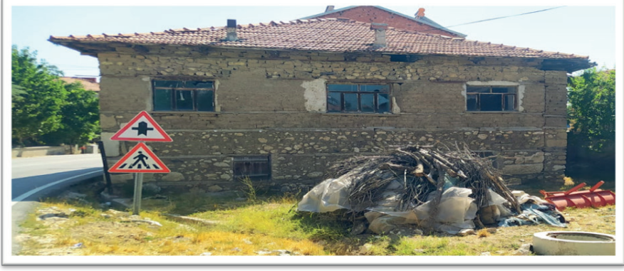
Resim 8. Geleneksel Ağlasun Evleri (18 Ağustos 2023).

doğramaları, duvar işlemleri ve çatı iskeleti gibi unsurlar ahşap malzemeden yapılmıştır. Geleneksel Ağlasun evleri genellikle iki katlı şeklinde inşa edilmiş olup, alt katta büyükbaş ve küçükbaş hayvanlar için ağır ve ambar mevcuttur. Evlerin ikinci katında ise odalar ve saçak adı verilen teras mevcuttur (Altınok, 2016).