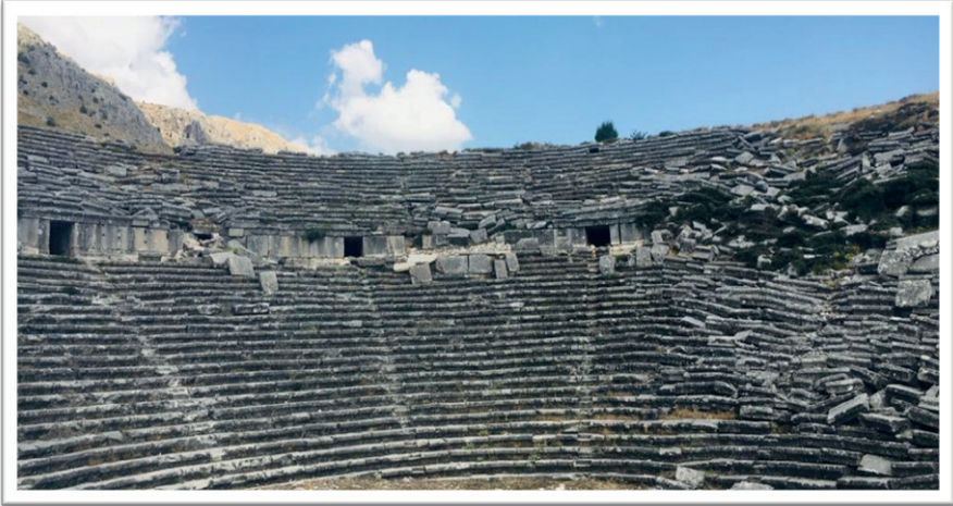
Resim 3. Antik Tiyatro (02 Eylül 2023).

Hellenistik dönemde konumu nedeniyle önem kazanan şehir, zamanının önemli bir ekonomik merkezi haline gelmiştir. Toros Dağları üzerinde kurulan Sagalassos Antik Kenti'nde, yerel seramik endüstrisi, tahıl ve zeytin bölge ekonomisinin en önemli ürünleri olmuştur (Aysal ve Caran, 2018). Sagalassos Antik Kenti, Türkiye'nin iyi korunmuş antik kentlerinden birisidir. Bölgede kültür turizmi kapsamında önemli bir yere sahip olan antik kent, Ağlasun ilçesinin sosyo-kültürel ve ekonomik anlamda gelişmesi için bir araç olarak kullanıla bilinir (Ongun vd., 2017).